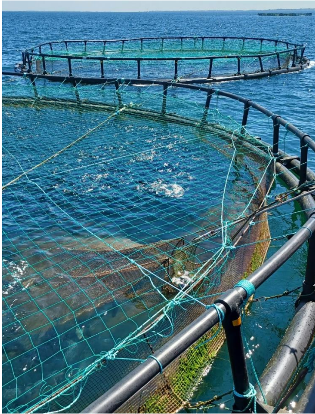
Tømning af dødeposen

De døde fisk fra Rågø, Onsevig, Fejø og Skalø havbrug samles i samme spand/tønne med låg og sendes til forgasning. Dødeposen indeholdt ved tilsynet flere fisk.