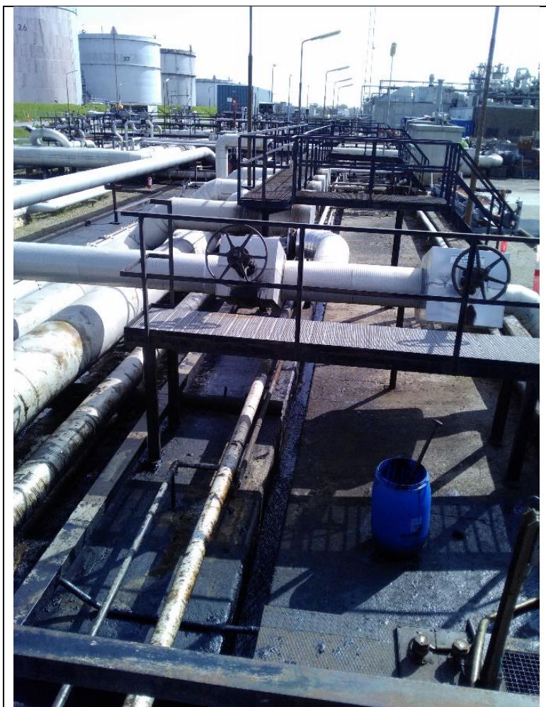
Befæstet areal ved BOB-kloak