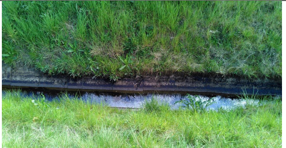
AOC- grøften langs vej 15

Vandet, der løber i COC-grøften langs vej 8 kan stamme fra hele raffinaderiet, og vandet har været igennem to olieudskillere inden det når COC-grøften ved vej 8. Ved kraftige regnhændelser bliver opholdstiden i olieudskillerene forkortet og dermed er olieudskillerne ikke så effektive som normalt. Langs vej 8 er der et arbejde i gang med at få COC-kanalen rør-lagt. Tidshorisonten for, hvornår dette arbejde færdiggøres er pt. ukendt.