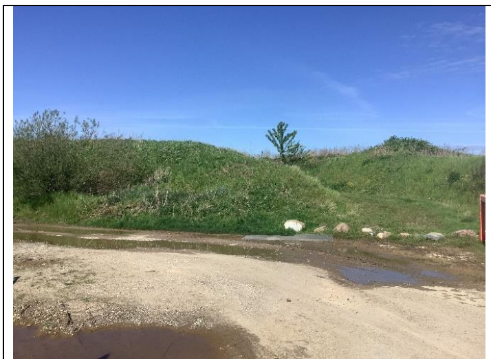
Fra den gamle brandøvelsesplads, set mod vest

Arealet for den tidligere brandøvelsesplads (taget ud af drift i 1990'erne) blev besigtiget. Den tidligere brandøvelsesplads er befæstet med SF-sten, området så tilfredsstillende ud. Der er foretaget ikke aktiviteter på stedet.