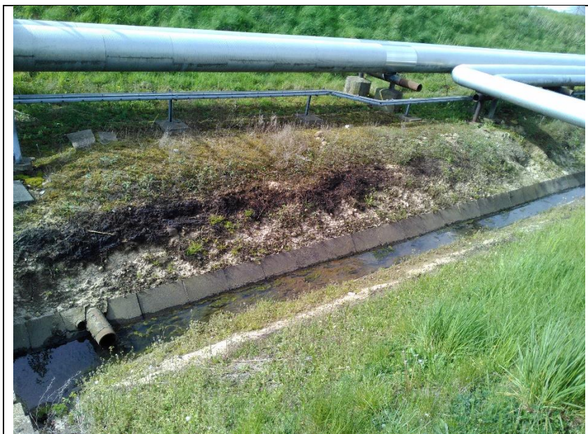
AOC-grøften langs vej 6

Vandet der løber i AOC-grøften langs vej 6 er overfladevand, der kommer fra DFR-området samt procesområdet. Der er tilløb mange steder, dvs. at vandet der løber i grøften langs vej 6 er en blandning af overfladevand fra forskellige steder. Regnvandet samles i AOC brønde, og ved evt. spild på belægning kan der ske oliedudslip til AOC systemet. Crossbridge forklarede, at der ved kraftige regnhændelser, som d. 25. august 2023, hvor der skete overløb, kan ske "oliemedrivning", hvor olie, der ellers sad på overfladen af rørene/brønde bliver skyllet af som følge af den store mængde vand og øget turbulens i røret. Oliemedrivningen kan evt. forklare de høje koncentrationer, der er påvist i overfladeprøverne, der er udtaget omkring vej 6 og vej 8.