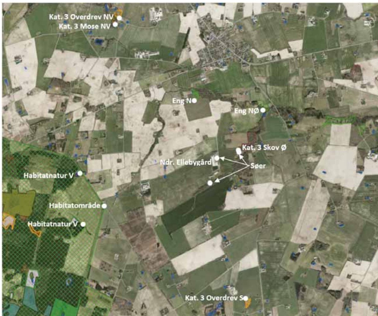
Figur 4. Beregningspunkter for ammoniak i området omkring Ndr. Ellebygård

Resultatet af beregningen af ammoniakdeposition i de angivne punkter i ansøgt drift kan ses i tabellen.