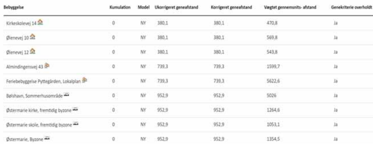
Tabel 7. Resultat af lugtberegning fra ansøgningskemaet i husdyrgodkendelse.dk.

Nærmeste byzone er Østermarie. Afstanden fra lugtcentrum til byzonegrænsen skal være minimum ca. 953 m, og den beregnede afstand fra lugtcentrum er ca. 1.354 m. Områder ved hhv. Østermarie Skole og Kirke er udpeget som fremtidig byzone. Afstanden til det nærmeste område er 1.053 m.