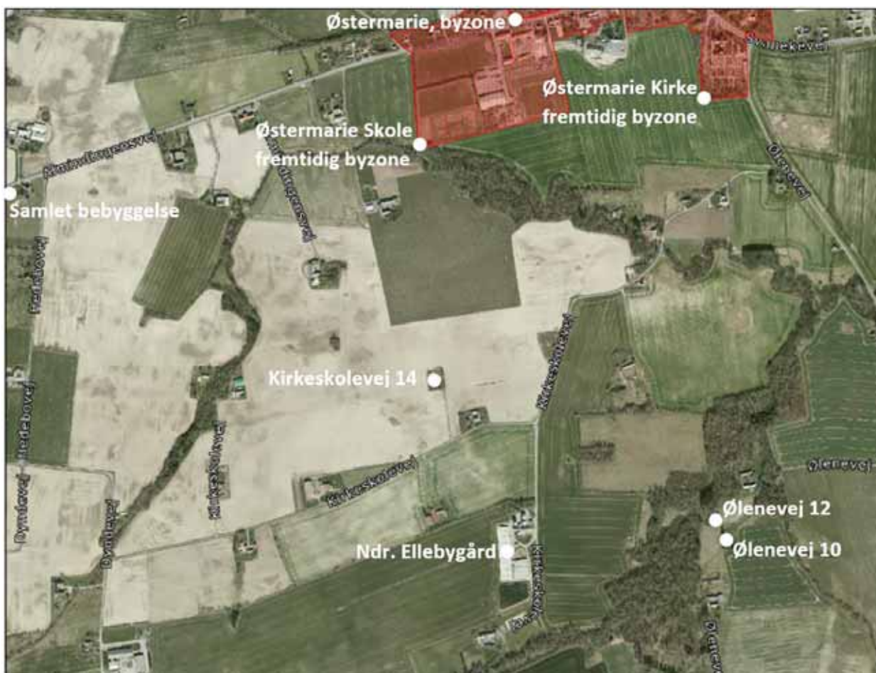
Figur 3. Beliggenhed af de nærmeste enkeltboliger, samlet bebyggelse og byzone.

Ansøger oplyser, at svineri i stierne søges elimineret ved optimal styring af ventilationsanlæg og brug af overbrusningsanlæg. Hvis der forekommer svineri i stier med fast gulv, skrubes de rene med henblik på at sikre lavest mulige ammoniak- og lugtemission.