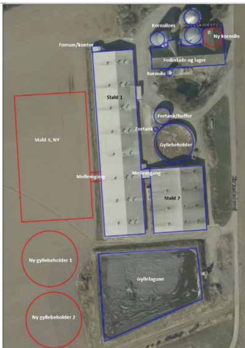
Figur 5. Anlægget på Ndr. Ellebygård med eksisterende og projekteret bygninger

Anlægstegning for ansøgt drift med detaljer kan ses på bilag 2