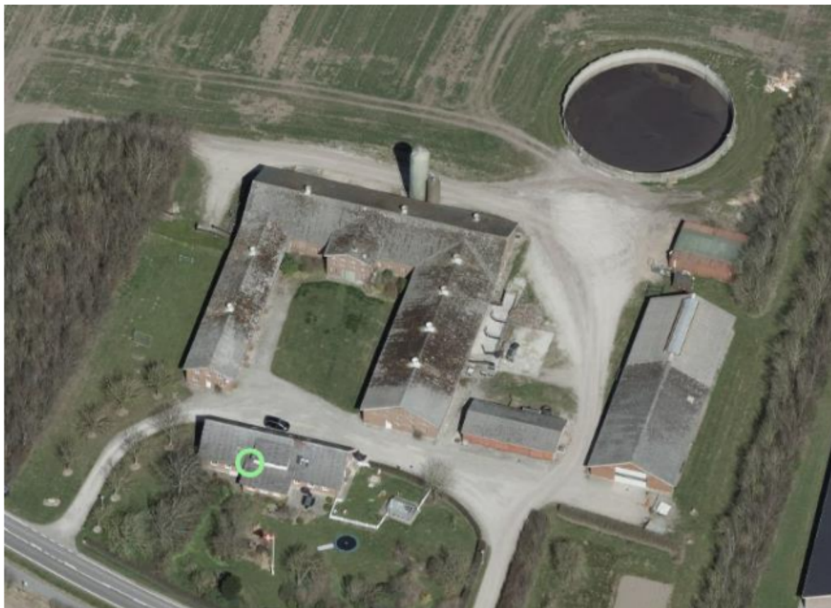
Figur 1 - oversigtsbillede af husdyrbruget

Husdyrbruget vil fortsat se ud som følgende oversigtskort