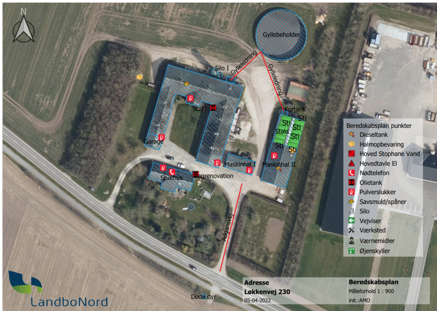
Figur 5 - miljøtegning