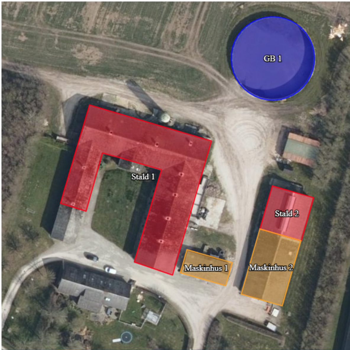
Figur 2 - husdyrbrugets driftsbygninger