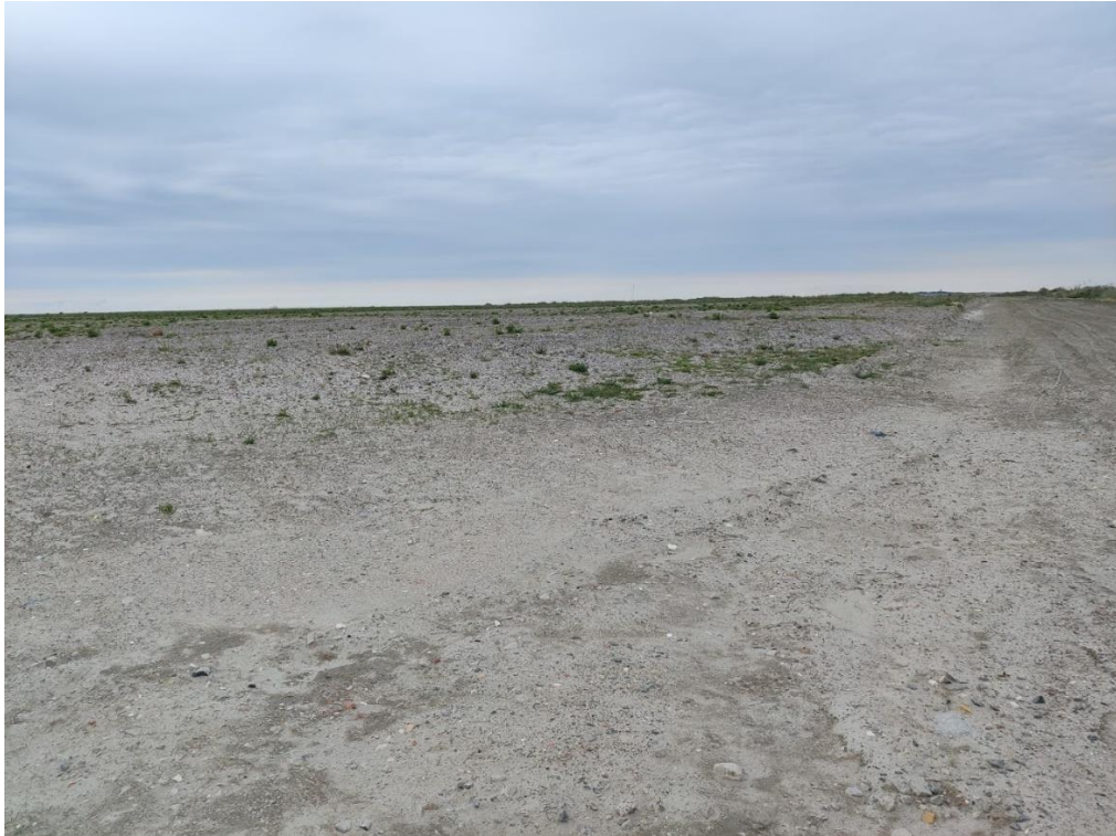
Foto 1.: Depotaftsnit 1. Billedet taget fra den centrale del af deponiet (krydset) mod nord.