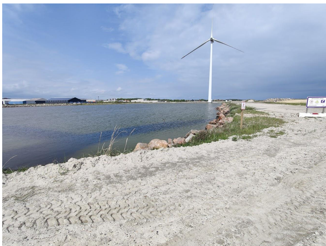
Foto 4.: Depotafsnit 4. Billede taget fra det østlige hjørne mod vest.