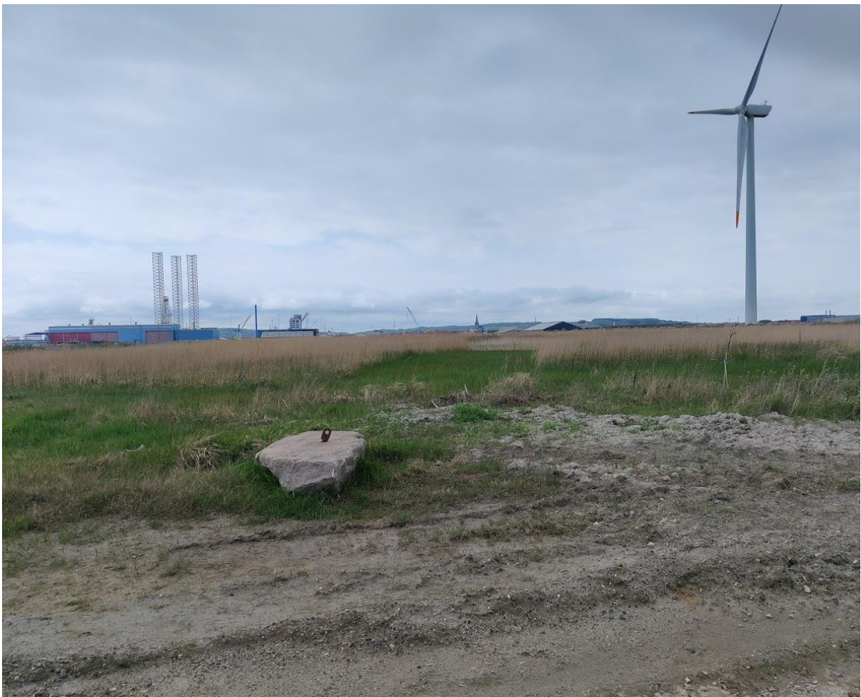
Foto 2.: Depotaftsnit 2. Billede taget fra den nordlige ende af deponiet mod sydøst.