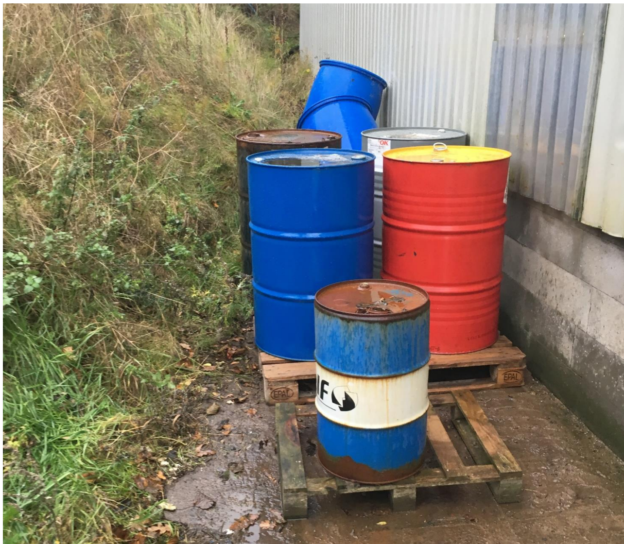
Tønder med spildolie placeret udendørs på støbt plads med afløb til nedgravet opsamlingskøle.

Opbevaringen sker på støbt plads med afløb til nedgravet tank. Der foretages ikke påfyldning på stedet og der var ikke tegn på spild fra tønderne. Opbevaringen accepteres.