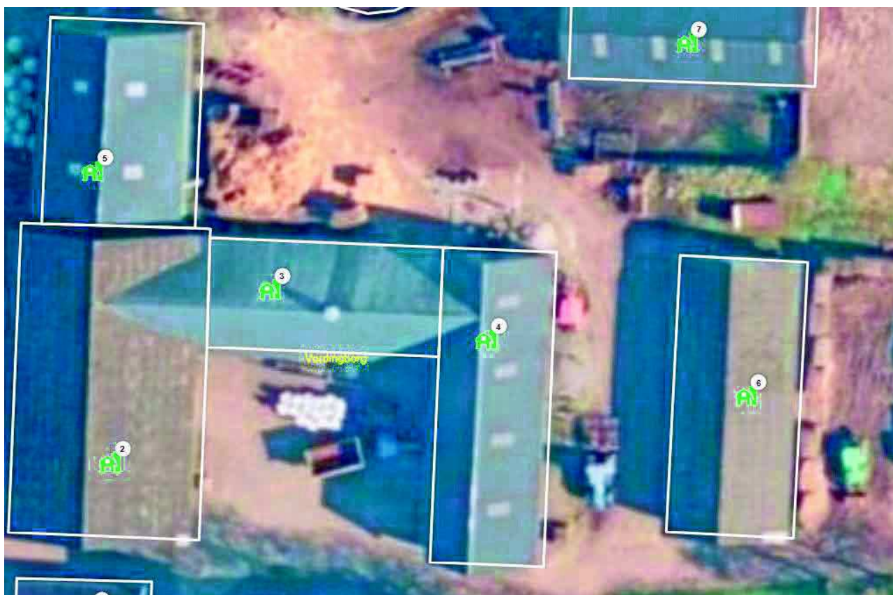
Figur 1 Billeder af bygninger fra BBR, det er i bygning 4 der er gedestald.

Gedeholdet er etableret i eksisterende staldbygning i bygning 4 i BBR.