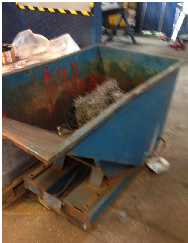
Oplag af metalspåner og -savsmuld i vippecontainer

Virksomheden har tidligere opbevaret jern- og metalaffald i en åben container udendørs. Affaldet indeholder metalspåner og -savsmuld, der er vedhæftet skærevæske. Virksomheden anvender en miljøvenlig vandbaseret skærevæske, men ikke desto mindre må denne ikke afledes til vandløb, som det fremgår af produktbladet for midlet. Regnvand fra virksomheden afledes til Brand Sø via vandløb, der er sårbare overfor miljøfremmede stoffer. Virksomheden har som aftalt ved seneste tilsyn i 2022 ændret opbevaringen af metalspåner og savsmuld, så det nu opbevares indendørs i vippecontainer indtil bortskaffelse. Der er boret hul i bunden af containeren, så overskydende skærevæske kan dryppe af i en mindre beholder. Ved tilsynet kunne det dog samtidigt konstateres, at der var en lille mængde fejlplacerede metalspåner i udendørs container uden låg.