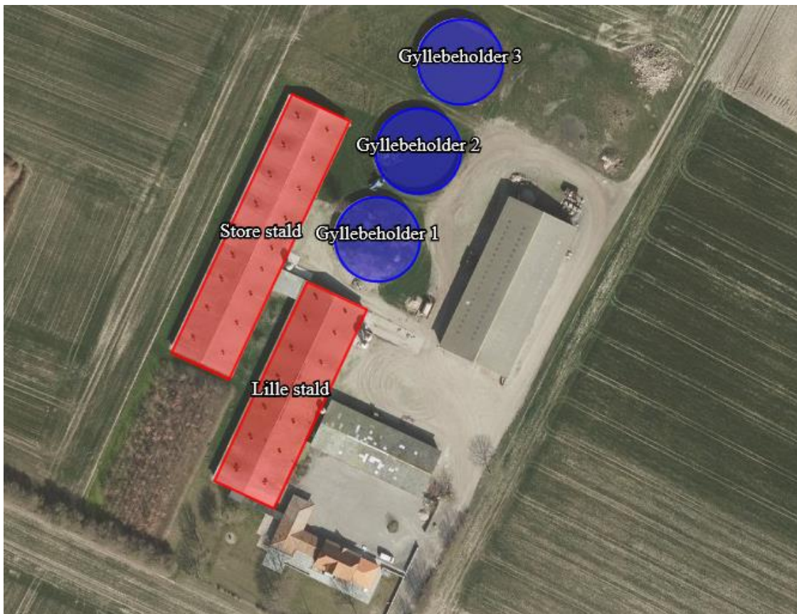
Kort 1: Oversigtskort over stalde og gyllebeholdere.