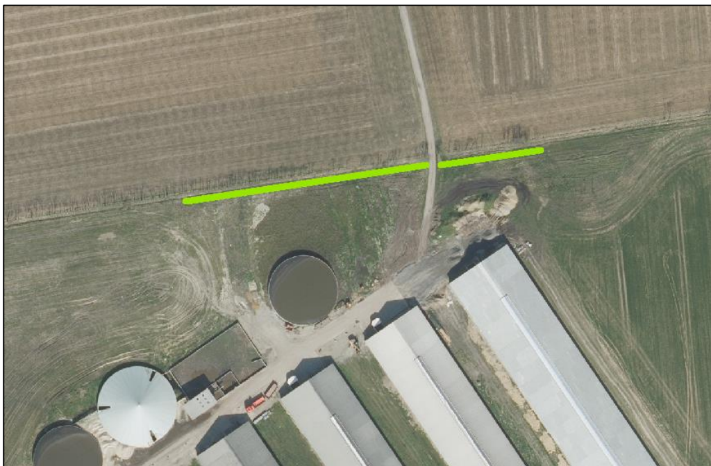
Figur 2a. Placering af beplantning nord for ejendommen.

I forbindelse med høring af parter er der indkommet bidrag om gener fra ejendommen. For at imødegå dette, er der stillet yderligere vilkår (vilkår 34) om beplantning nord for ejendommen – se nedenstående figur.