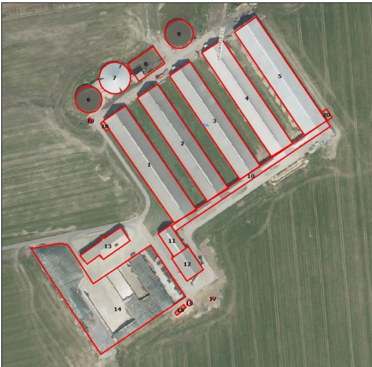
Figur 1. Husdyrbrugets driftsbygninger.