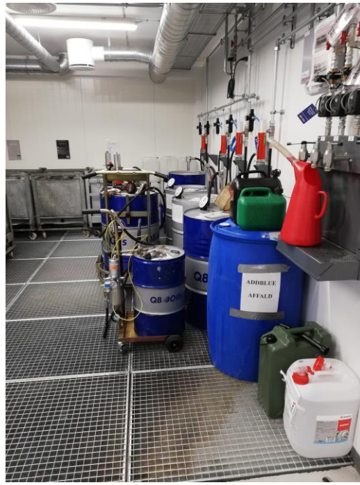
Rum til kemikalieaffald