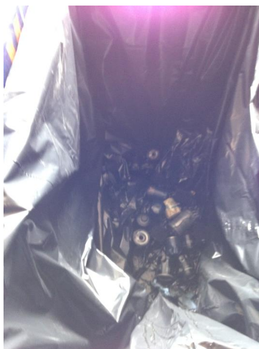
Container til oliefiltre i dæklager