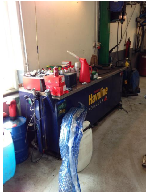
Filbænk til motorolie i værksted mv.