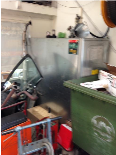
Motorolietank i værksted