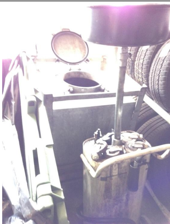
Spildolietank i dæklager