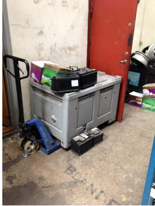
Kasse til batterier i lager