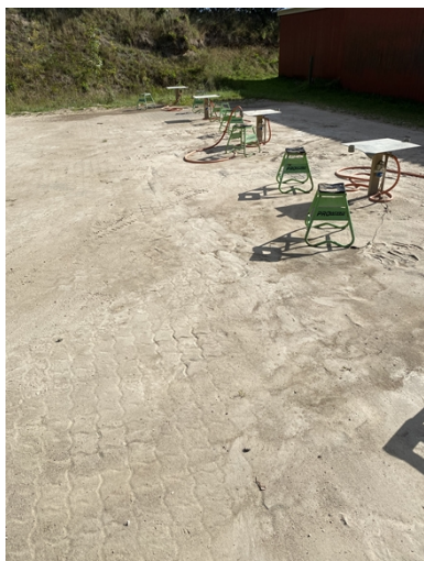
Plads til vask af crossmaskiner