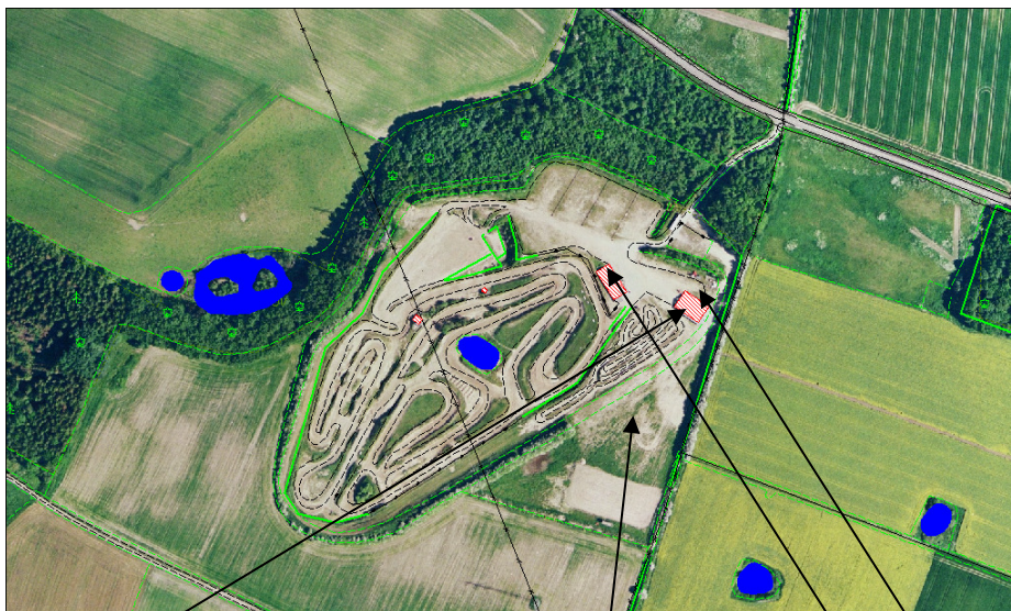
Oplag af farligt affald og dieseltank (indendørs) Microcrossbane Klubhus Vaskeplads

Virksomheden er indrettet og drives som beskrevet i virksomhedens miljøgodkendelse med tillæg.