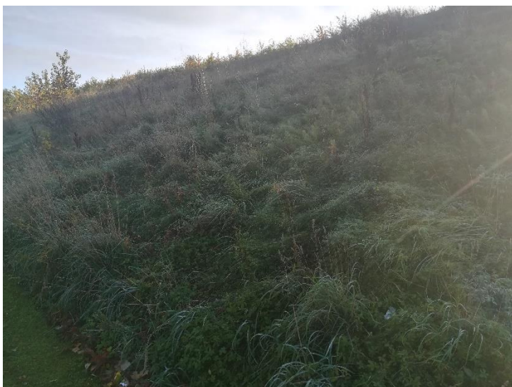
Billede 3 Volden set fra fortovet. Volden fremstår tæt bevokset.