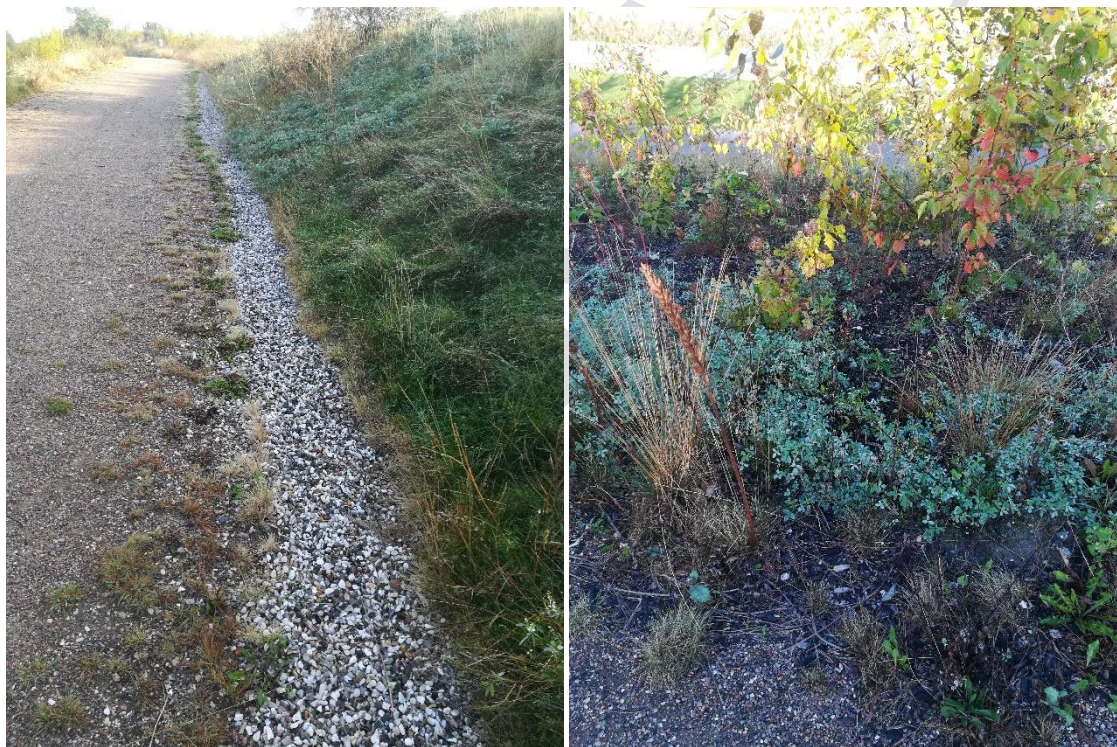
Billede 2 Venstre: Randdræn langs grusvejen på volden. Højre: Billede af skrænten set fra toppen.

Under dette tilsyn kunne tilsynsmyndigheden konstatere, at slutafdækningen fortsat er intakt og volden fremstår med tæt beplantning på skrænterne og uden huller i grusstierne.