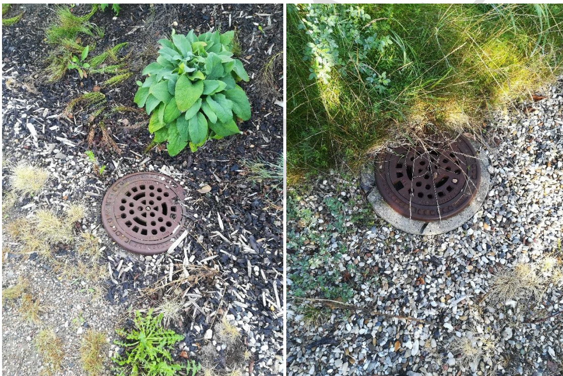
Billede 4 Dæksler, der blev fundet på volden

Under tilsynet blev der fundet flere dæksler på støjvolden. Det var uklart for både tilsynsførende og virksomhedens repræsentant, hvad formålet var med disse dæksler. Det er aftalt at Glotrup kommune vender tilbage med en afklaring om disse.