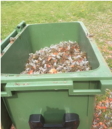
Billede nr. 4: Opsamling af plasthaglskåle.