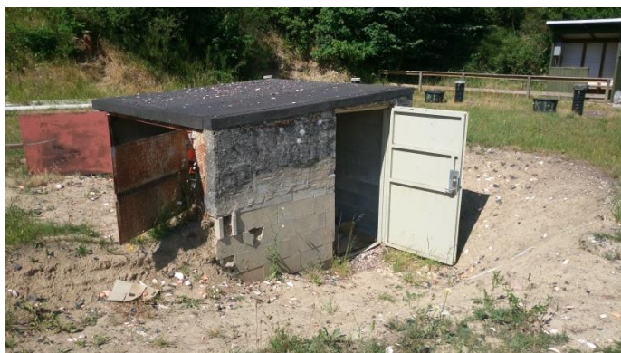
Billede nr. 1: Udgravning ved maskinhusene.

Jagtforeningen har i 2016 gravet jord ud omkring maskinhusene, så adgangsforholdene er blevet forbedret.