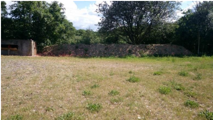
Billede nr. 2: Jordvold lavet af overskudsjord fra udgravning ved maskinhusene.