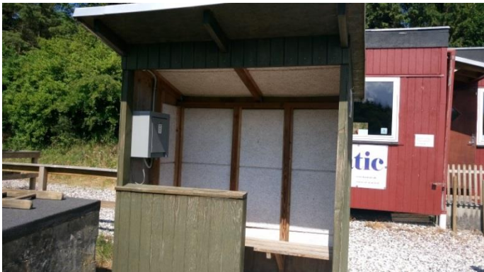
Billede nr. 3: Støjisolerede læskure.

For at dæmpe refleksioner er læskurene indvendigt beklædt med troldekt.