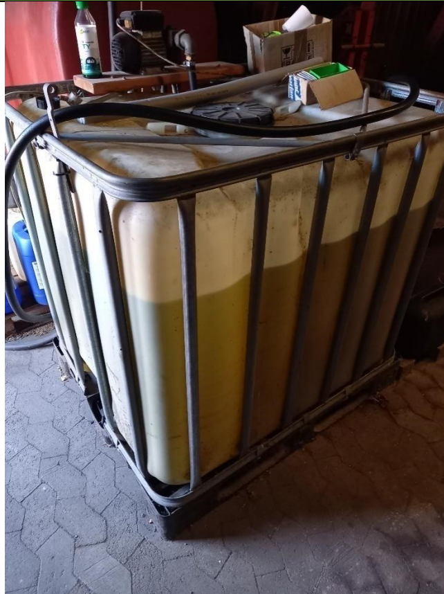
Billede 3: palletank med dieselolie

Autoværkstedet blev gjort opmærksom på, at palletanken udgjorde en risiko for forurening af jord og grundvand, da den var placeret på SF-sten, der ikke anses for at være en tæt belægning.