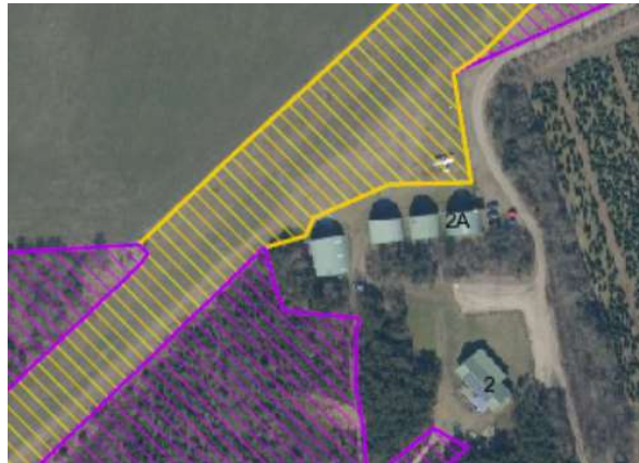
Figur 1: §3-områder nær hangar. Gult er overdrev, lilla er hede

Nærmeste registrerede §-3 område ligger lige op ad hangaren, se nedenstående foto.