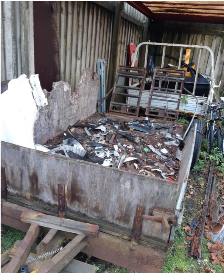
Trailer hvor du samler metalaffald. Placeret delvist i det fri og delvist under tag