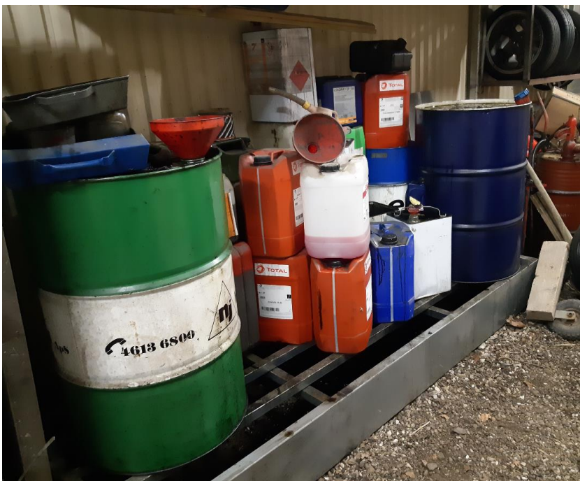
Spildbakke med beholdere med og uden indhold, hvoraf en del slet ikke bruges

På www.helsingor.dk/databeskyttelse finder du oplysninger om, hvordan kommunen behandler personoplysninger samt kontaktoplysninger på vores databeskyttelsesrådgiver.