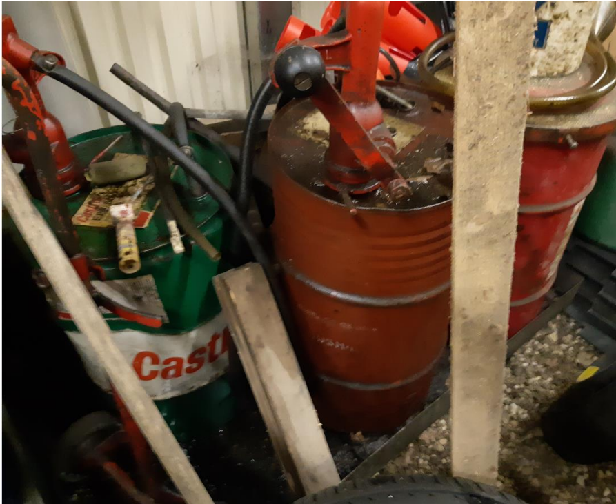
Transmissionsolie og fedt på spildbakke