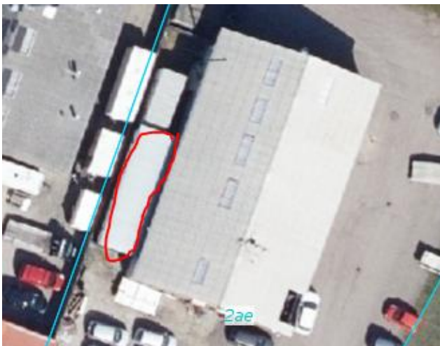
Placering af skur med spildbakke

Spraydåser og tomme tuber samles i en murerbalje og I kører selv til Skibstrup Affaldscenter. Du har kvitteringer på aflevering af dette.