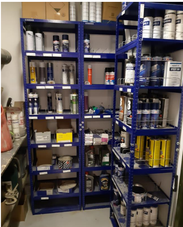
Kemirum inde i bygning