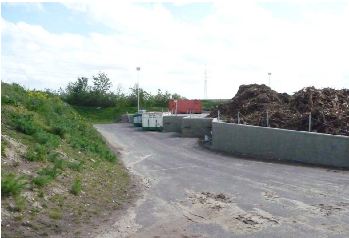
Foto fra tilsyn 30. maj 2011, der viser containergrav og asfalteret plads