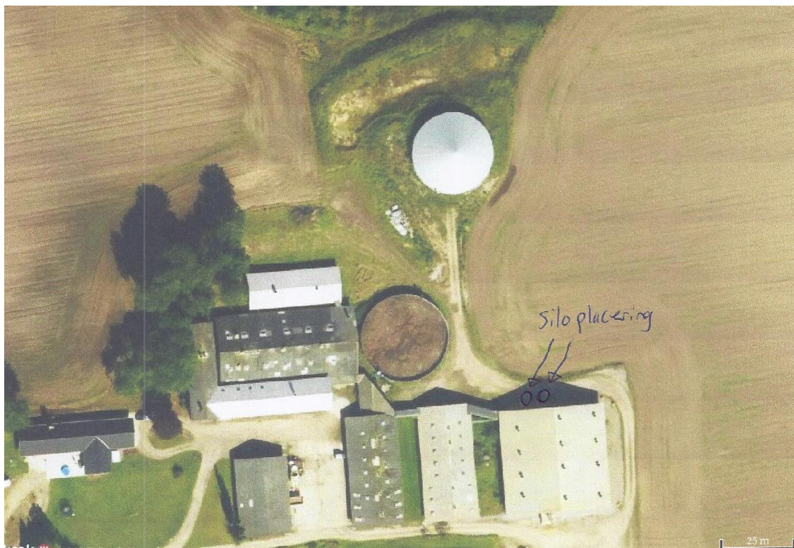
Situationsplan, fra ansøgningsmaterialet.