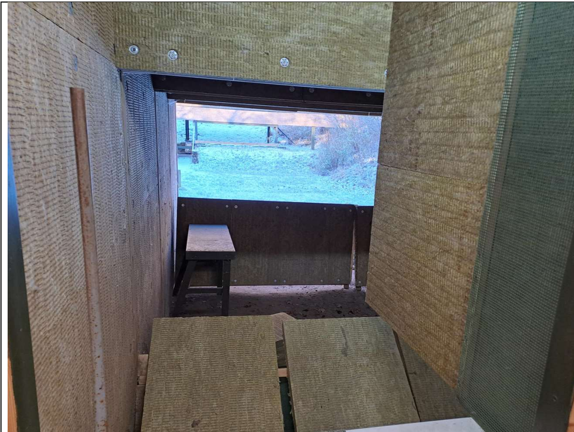
Foto2 Støjdæmpning af standplads på 50 meter banen