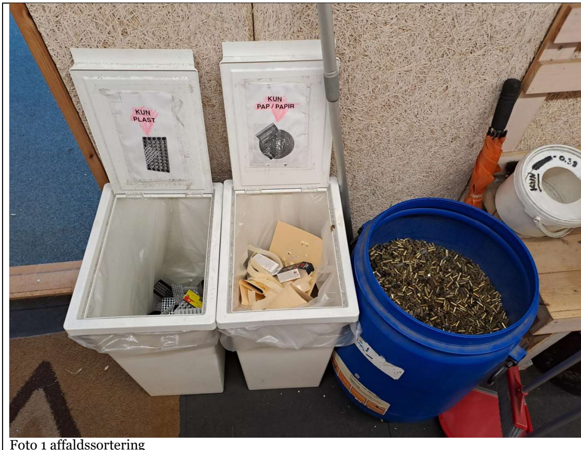
Foto 1 affaldssortering