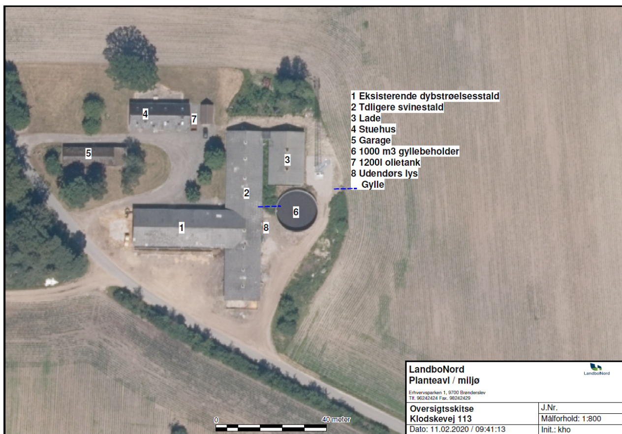
Figur 1: Anlægstegning