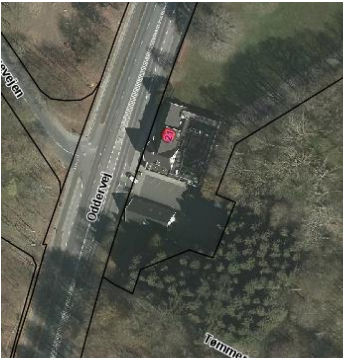
Luftfoto af skydebanen syd for Restaurant Frederikshøj med matrikelskel, anno 2019

Skydebanen ligger ud for et anneks syd for Restaurant Frederikshøj. Ejendommen ligger i område 11.00.01N.A., som er udlagt til jordbrugs- og naturformål. Mod nordøst ligger boligområdet 11.08.08.BO i en afstand af 160 meter.