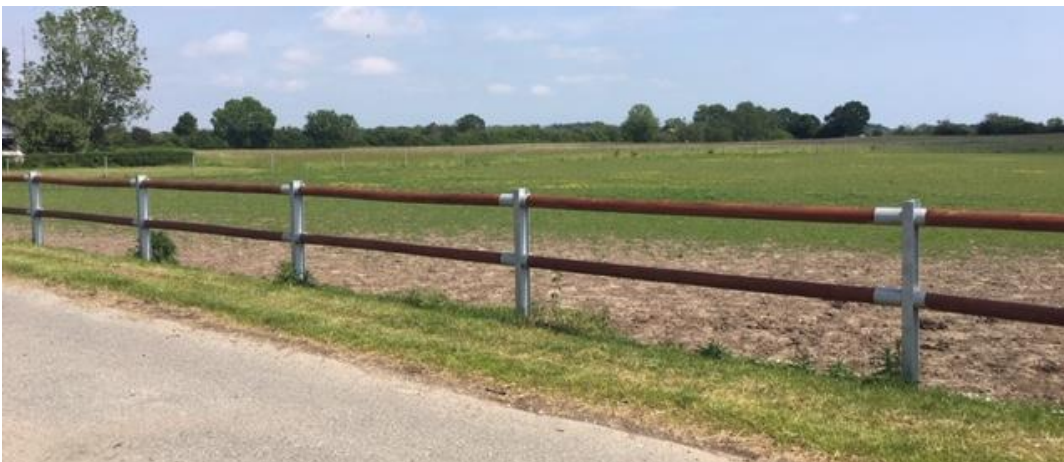
Figur 1. Foto af hegn ved Tingskovvej 31. Skridtmaskinen vil blive opført med denne type hegn.

Maskinen kører rundt ved en el motor, som er meget støjsvag, så den ikke gør hestene bange.