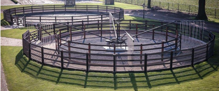
Figur 2. Eksempel på skridtmaskine af samme type som ansøgt