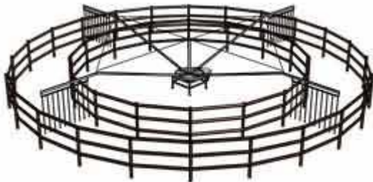
Figur 4. Tegning af skridtmaskine af samme type som ansøgt