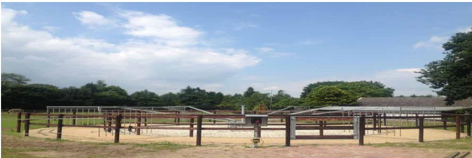
Figur 3. Eksempel på skridtmaskine af samme type som ansøgt