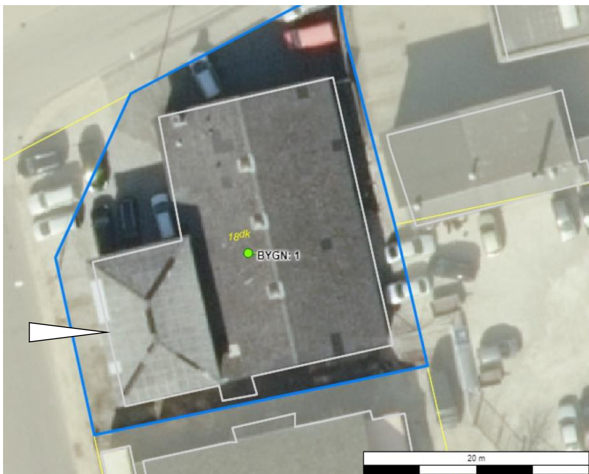
Luftfoto af ejendommen med matrikelskel

I forhold til kommuneplanen ligger virksomheden i erhvervsområde 160513ER. Området er omfattet af lokalplan 116, der udlægger området til blandet bolig og erhverv. Nærmeste bolig ligger i en afstand af ca. 65 meter mod sydvest. Virksomheden er indrettet i et værksted på ca. 175 m 2 – se hvid pil på nedenstående luftfoto. Den øvrige del af bygningen på ejendommen (bygning 1) anvendes af anden virksomhed på samme adresse, som er ejer af ejendommen og driver autohandel uden autoreparation.