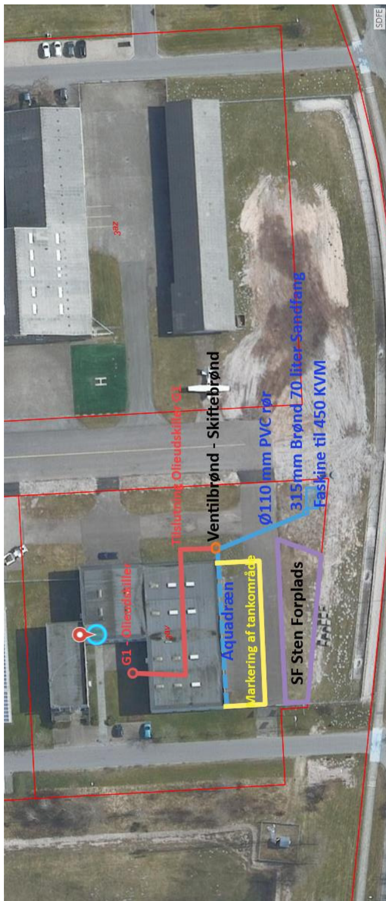
Befæstelses og- afløbsplan fra ansøgning