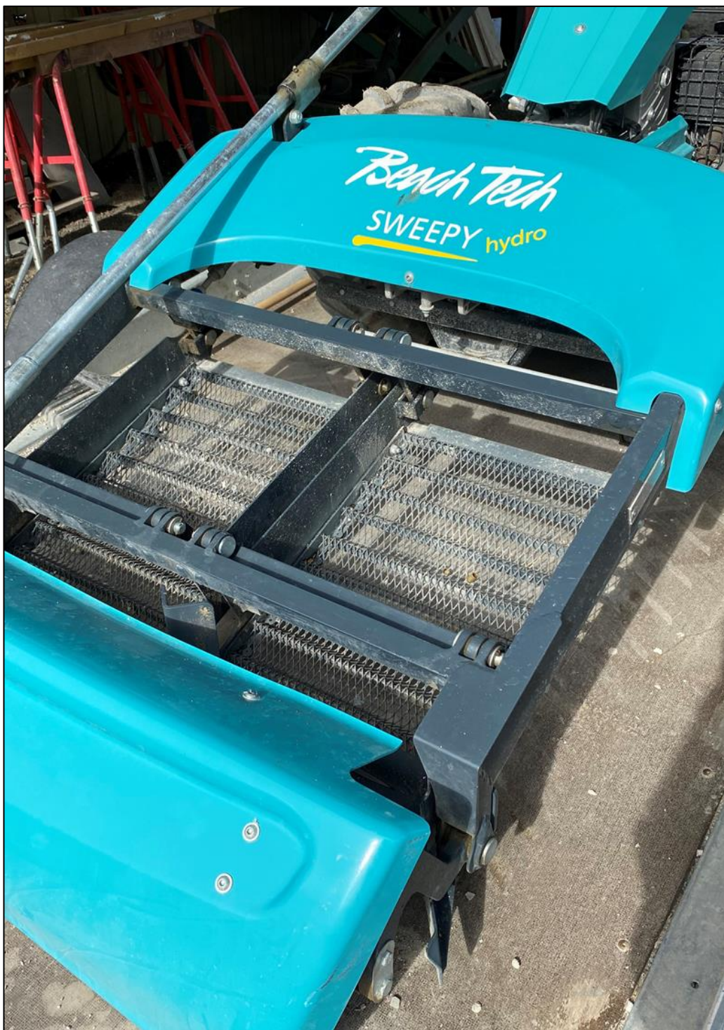
Beach Tech Sweepy (strandrenser), som Skyttecenteret for nylig har indkøbt, og som med succes bruges til at indsamle brugte messing patronhylstre på skydebanerne.