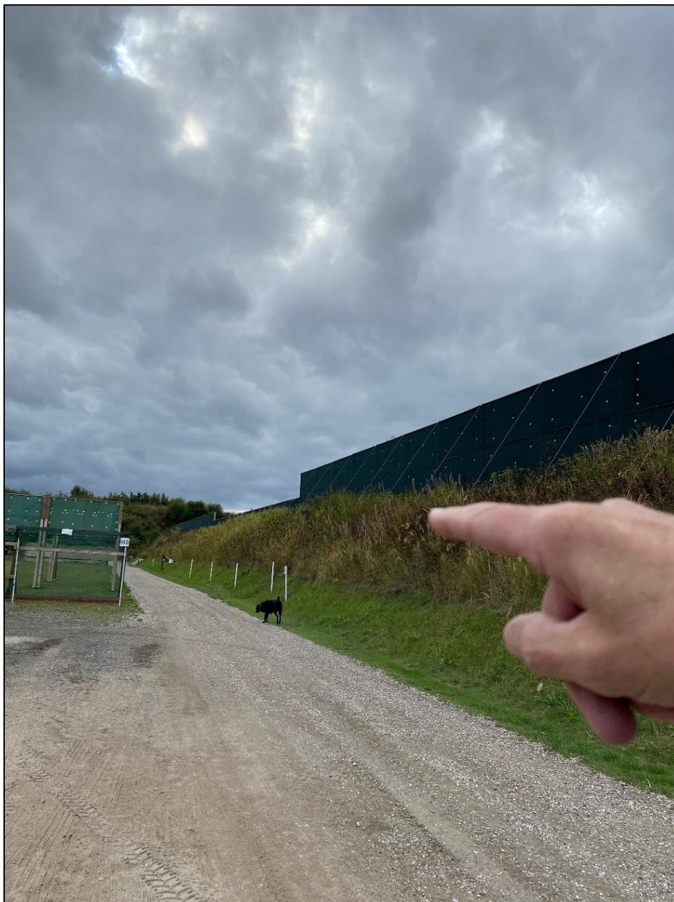
Støjskærme opsat på bagerste skydebaner. Læg mærke til de forhøjede skærme to steder, som sikrer at skudstøjen "fanges" ved skrå skudretning.