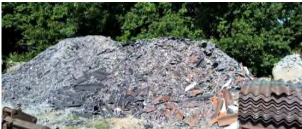
Knuste tagplader: sørg for dokumentation/analyse af, at tagpladerne ikke indeholder asbest!

Skal du udvide, renovere eller rive din ejendom ned, gælder der særlige bestemmelser for håndtering, sortering og bortskaffelse af bygge- og anlægsaffald, herunder tagplader med og uden asbest.