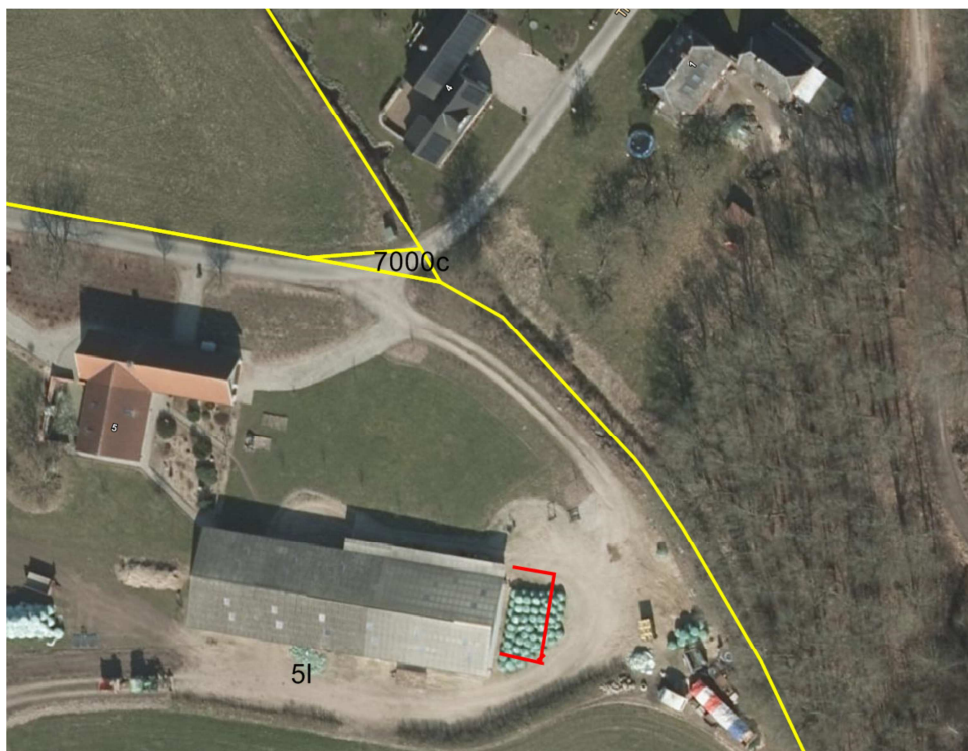
Skitse over staldudvidelse markeret med rød – skel er markeret med gul

Middelfart Kommune vurderer at placering af det nye staldafsnit på 72 m 2 , er af underordnet betydning i forhold til afstandskravet til naboskel på 30 m, idet den ansøgte staldudvidelse er erhvervsmæssigt nødvendig og opføres i tilknytning til eksisterende stald, samt den omhandlende nabomatrikel er en del af en ejendom registreret med skov og nærmeste nabobeboelse er beliggende i Assens Kommune ca. 75 m nord for planlagt staldudvidelse.