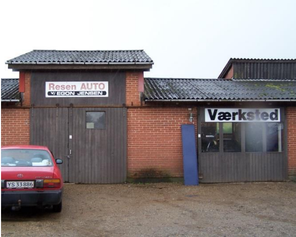
Udsnit af autoværkstedets facade