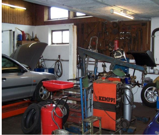
Udsnit af autoværkstedet