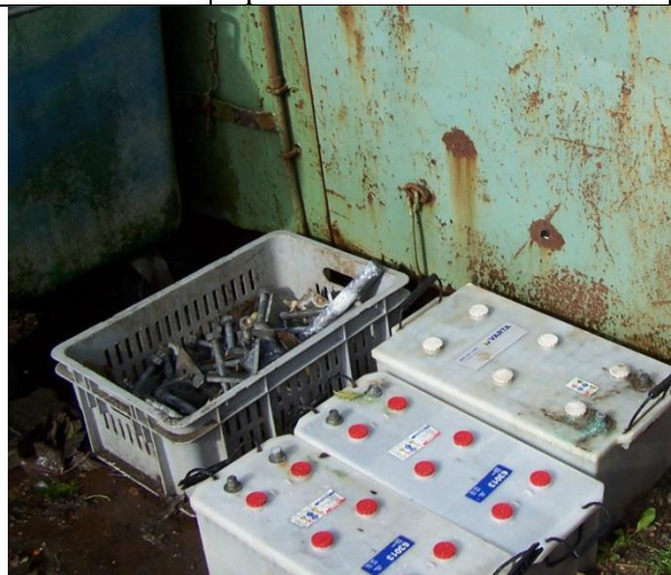
Akkumulatører placeret direkte på fugtig jordbund