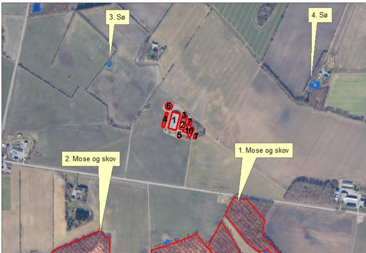
Figur 5. Kort over kategori 3 samt § 3 natur ved anlægget.

Merbelastningen til områderne er mellem 0,2 og 0,9 kg N/ha/år og ligger under beskyttelsesniveauet på 1,0 kg N/ha/år i merbelastning. Der er ikke foretaget beregninger af ammoniakdeposition til øvrige naturarealer, da Vejen Kommune vurderer, at naturarealer, der ligger længere væk end de i tabellen nævnte naturarealer, ikke vil blive belastet med over 1,0 kg N/ha/år.