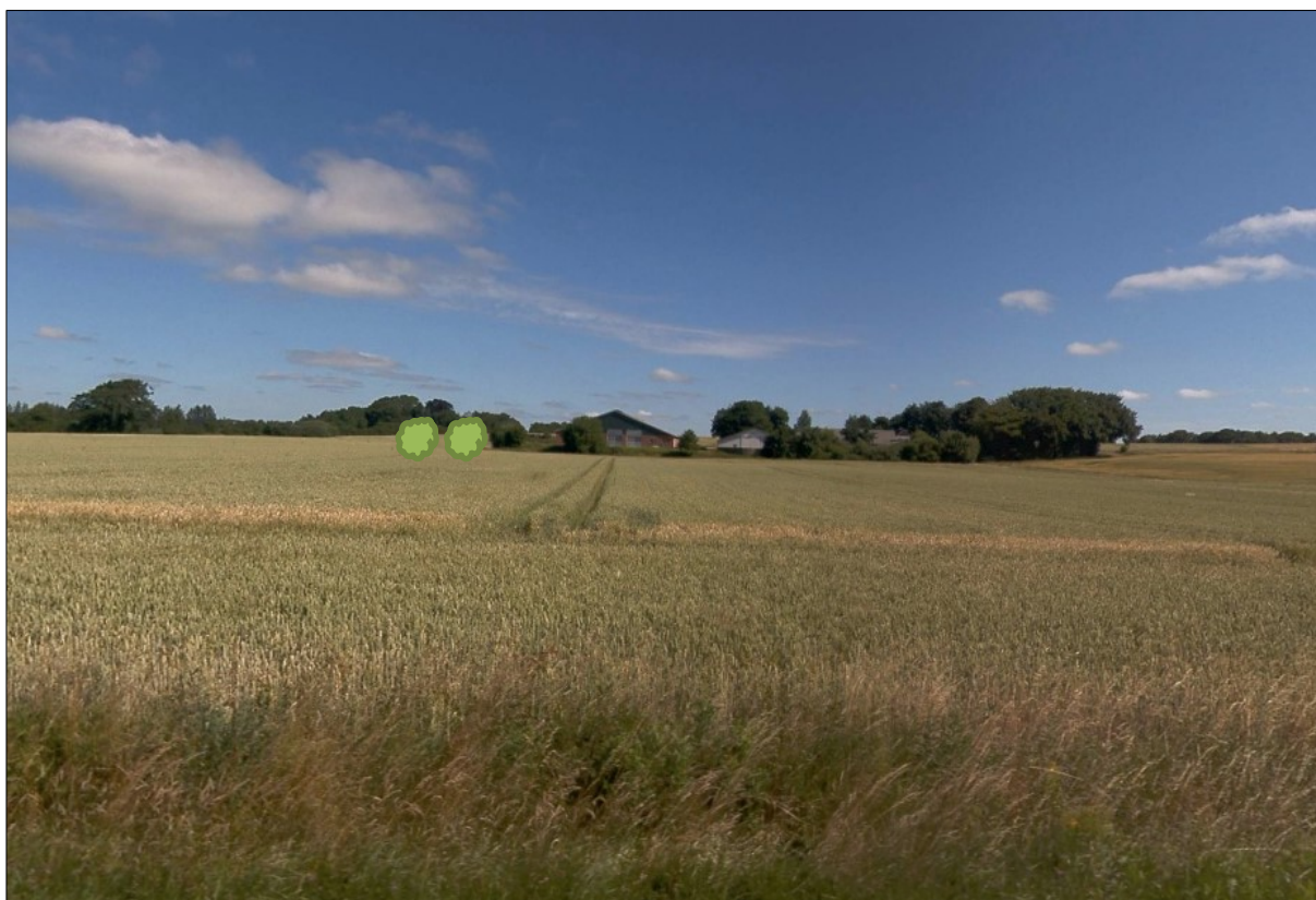
Figur 3. Viser hvor der skal etableres ny beplantning i forbindelse med etablering af stald 4 på figur 1.