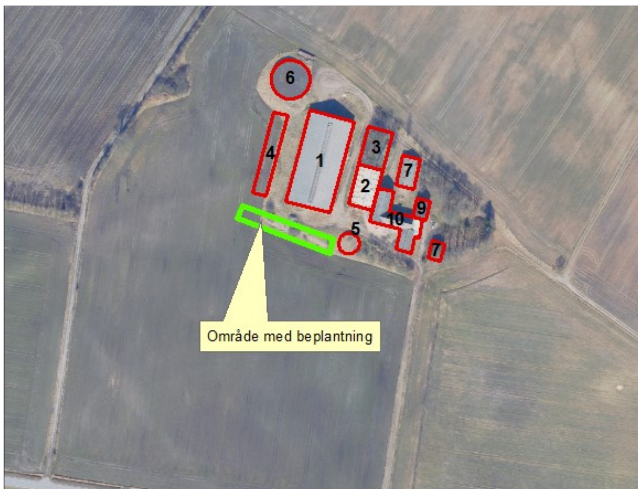
Figur 2. Viser hvor der skal etableres ny beplantning og hvor eksisterende beplantning skal bibeholdes.

Der er spredt beplantning der omkranser eksisterende byggefelt, som er med til at opbløde indsynet til ejendommen. For at sikre at den nye stald vest for eksisterende bygninger (nr. 4 på figur 1) ikke vil syne dominerende i landskabet, stilles der vilkår til spredt beplantning, samt fastholdende vilkår til den eksisterende beplantning. Beplantningen skal være i samme stil som eksisterende beplantning. Se nedenstående figurer om placering af beplantning.