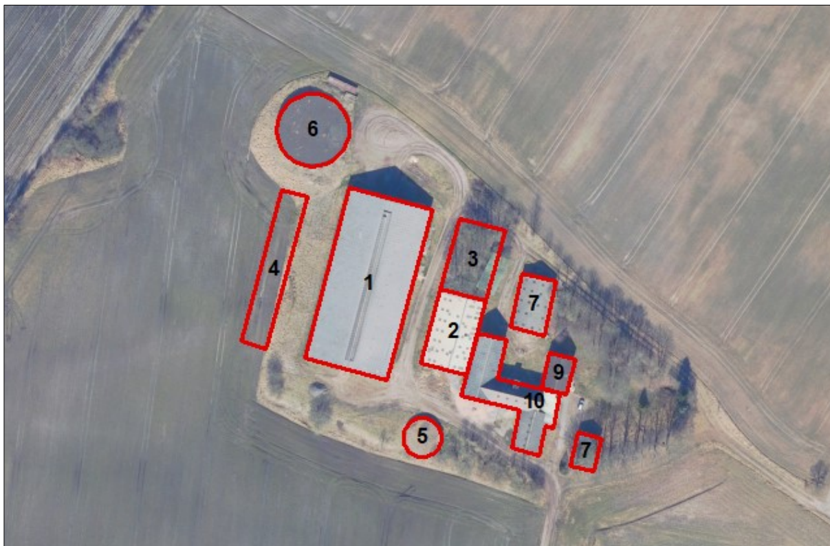
Figur 1. Husdyrbrugets driftsbygninger.