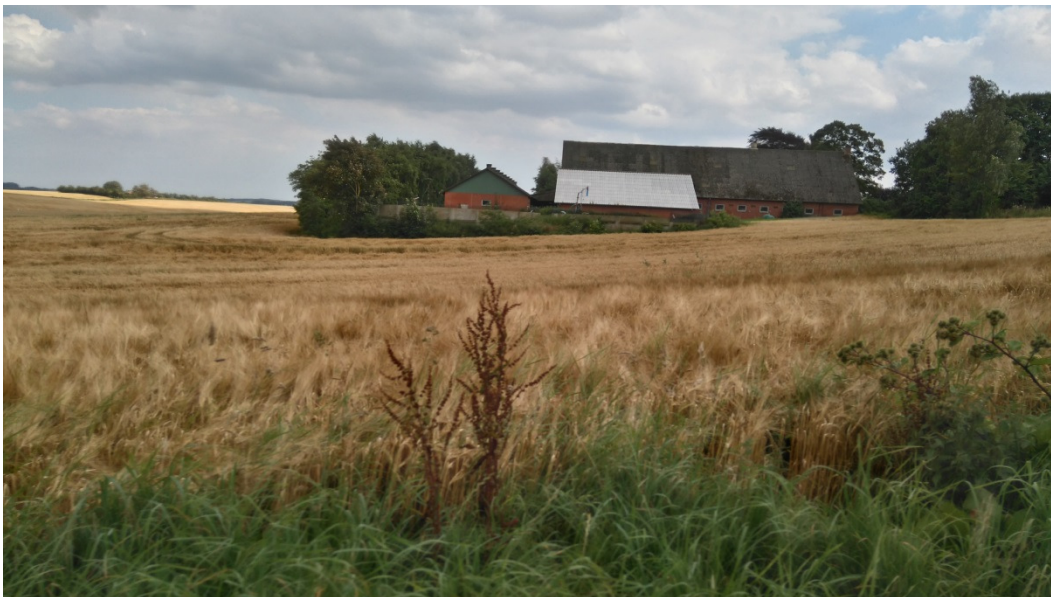
Krogsbækvej 20, set fra vest

I forhold til det landskabelige ligger området uden for udpegningerne værdifuldt kultur miljø, Bevaringsværdigt landskab, og geologisk interesseområde. Beholderen placeres lavere i landskabet end det eksisterende byggeri (se nedenstående billeder)