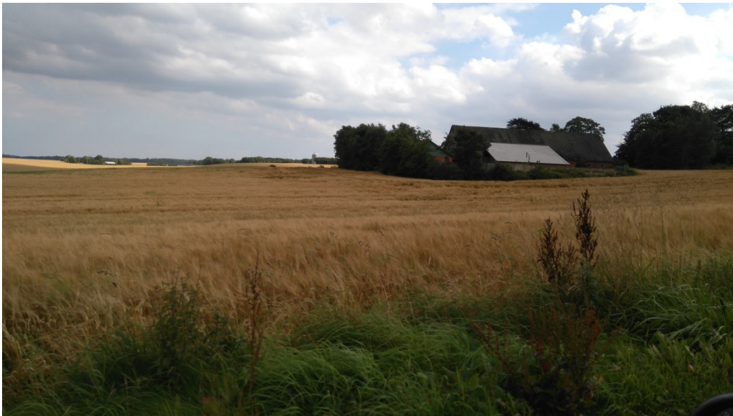
Krogsbækvej 20, set fra nordvest

Beholderen vil primært være synlig fra Krogsbækvej 25 og 27.