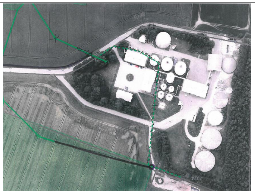
Markdræn omkring virksomheden.