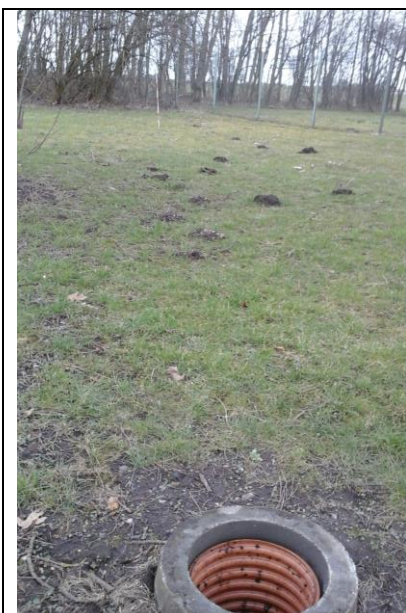
Dræn i haven, koblet på markdræne. Pind på billedet markerer start af dræn.

Der er ikke placeret et dræn under virksomhedens bygninger. På gamle kort kan ses et dræn, disse dræn er fjernet i forbindelse med opførelse af virksomheden. Dræn på virksomhedens areal i haven ud mod vejen har et rør hævet ca. 30 cm over niveau. Omkring virksomheden er placeret markdræn, idet virksomheden er placeret i et landområde.