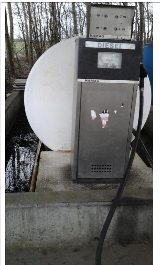
Tankareal med tag og tankgrav.

Tankpladsen er indrettet med tæt tankgrav til olietank på 5.900 l, tankgraven kan rumme tankens indhold og er etableret med tæt opsamlingsbrønd, hvorfra der kan fjernes dieselolie/regnvand spildt i tankgården. Brønden skal holdes tom. Over tankplads er etableret tæt tag. Tankning foregår på tæt befæstet område, der var ved tilsynet ikke tegn på spild. Alder på dieseltank bedes oplyst.