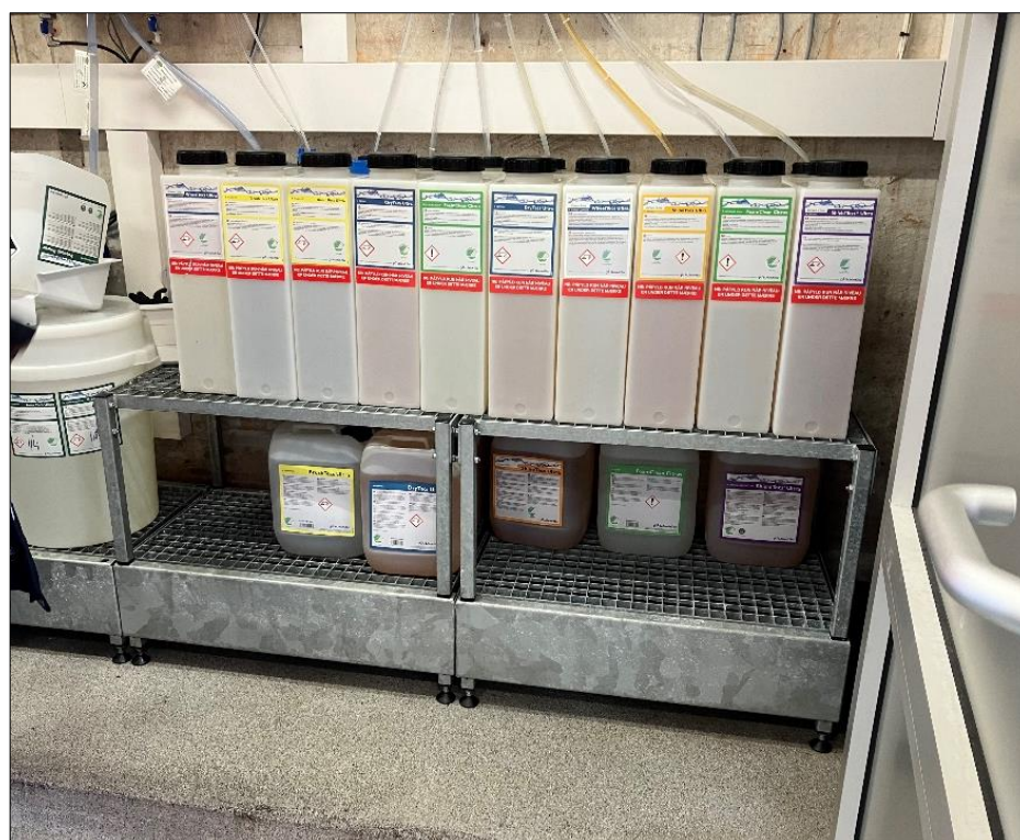
Figur 2. Vaskemidler

Alle vaskemidler står på nye spildbakker i kemirummet ved vaskehallen. Der er afløb i kemirummet.