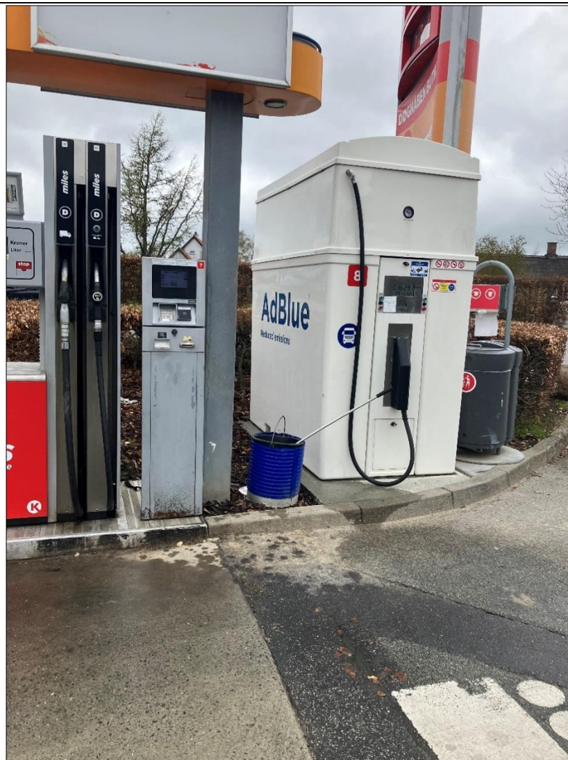
Figur 3. AdBlue