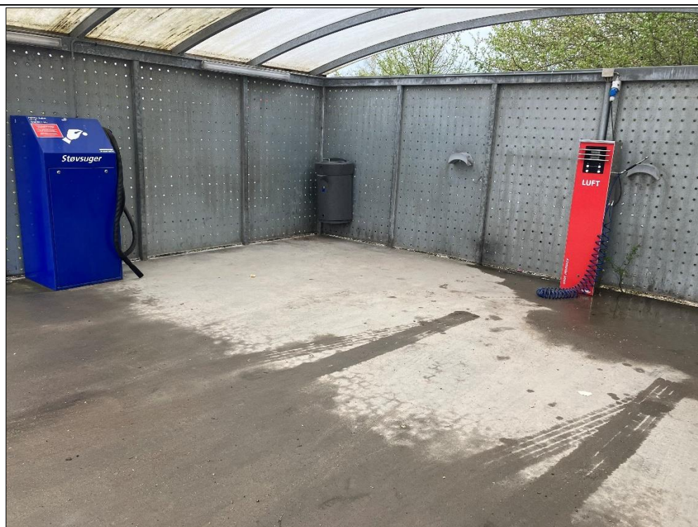
Figur 4. Pusleplads med støvsuger og dækpumpe