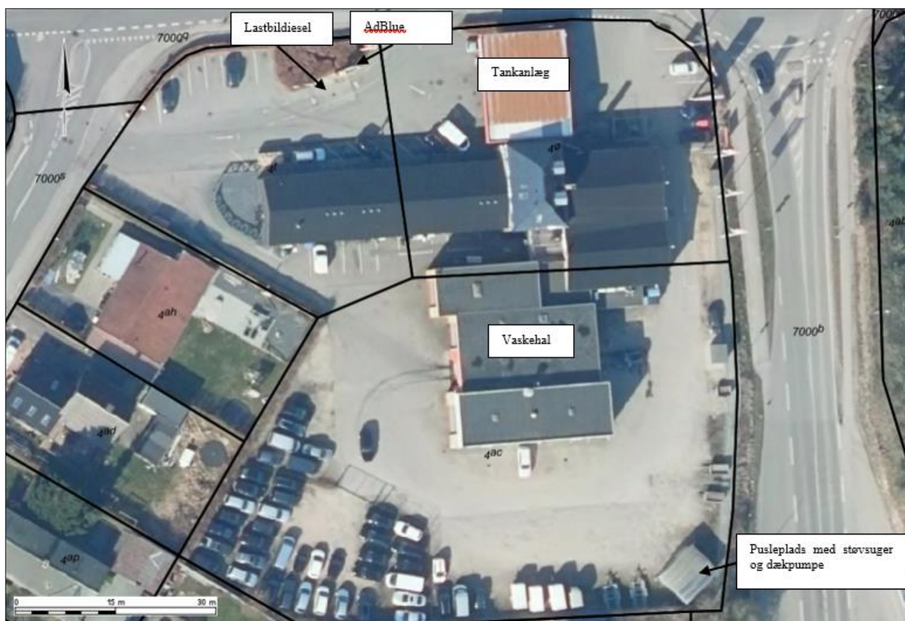
Figur 1. Oversigt over virksomheden