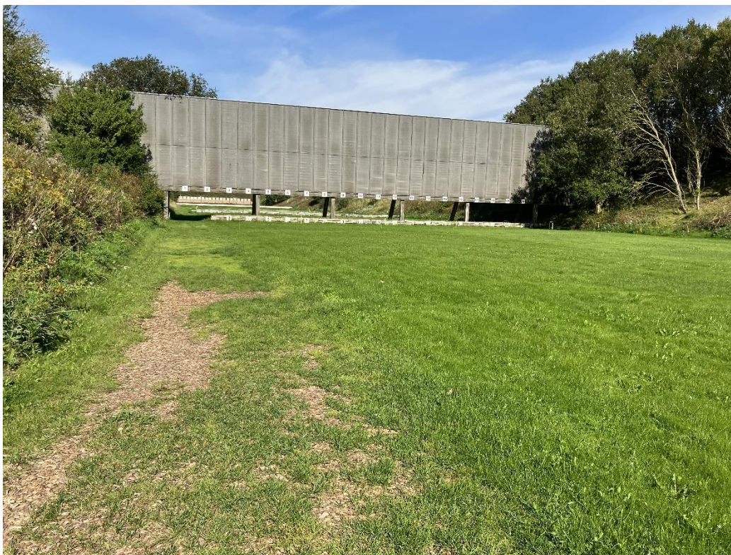
Skydebanen fra syd mod nord