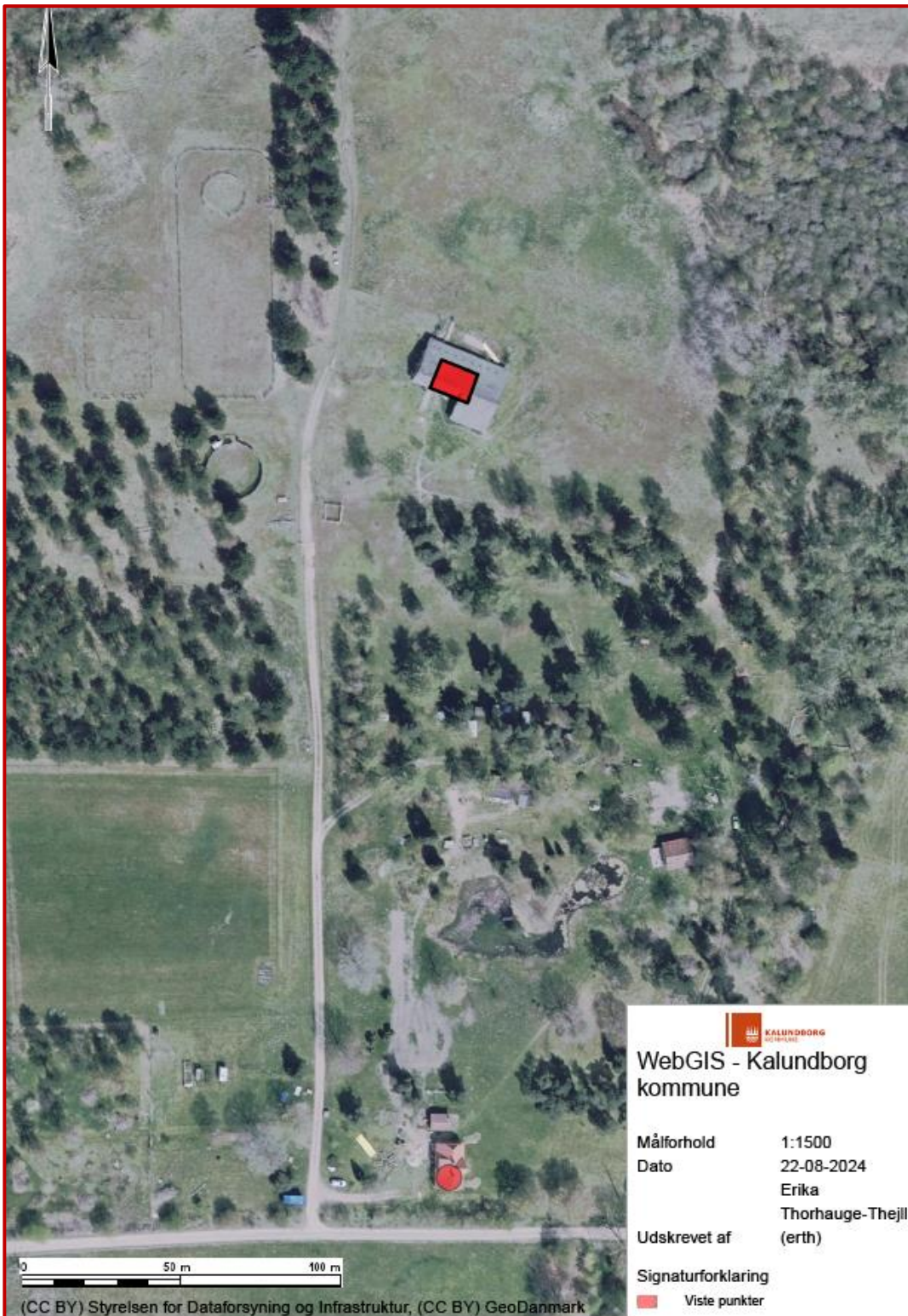
Figur 1: Oversigtskort med firkantet markering (rød) af produktionsareal/stald.