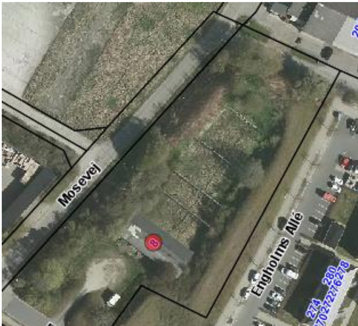
Luftfoto af skydebaneanlægget med matrikelskel, anno 2019

Skydebanen er beliggende i område 15.04.06.ER, som er udlagt til industri og tungere værksteds-, lager- og entreprenørvirksomhed m.v. Området grænser SØ op til boligområdet 15.04.05.BO. Den mest støjbelastede ejendom, der kan anvendes som bolig (Mosevej 17) ligger i banens skudretning ca. 100 meter nord for banens standpladser. Ejendommen er opført som bolig, men anvendes p.t. som kontor.