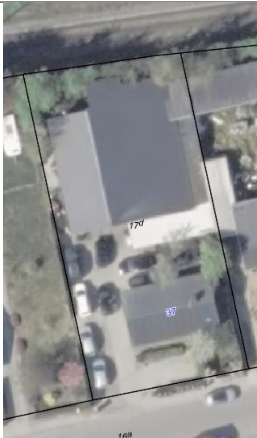
Luftfoto af adressen. Bygningen længst mod nord er autoværkstedet. Mod syd er der placeret en bolig.