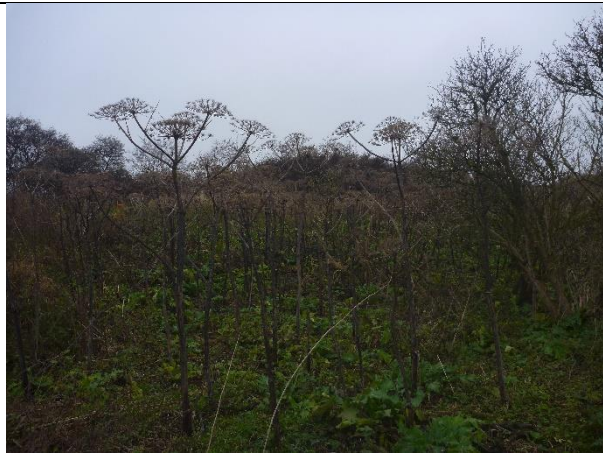
Fig. 7 Område med stor bjørneklo