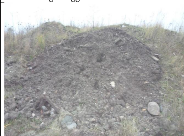
Fig. 5 Små oplag af brokker, jord, imprægneret træ m.m.