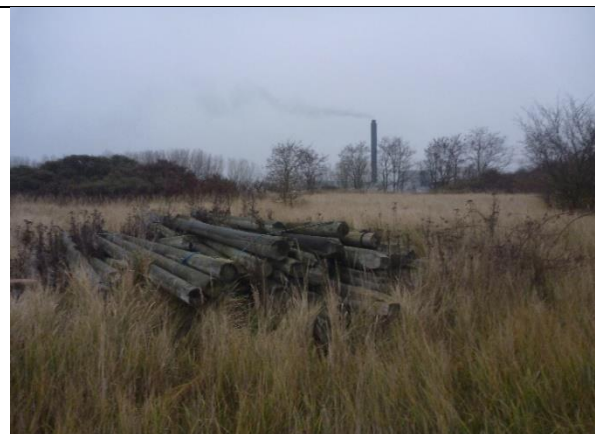
Fig. 6 Små oplag af brokker, jord, imprægneret træ m.m.