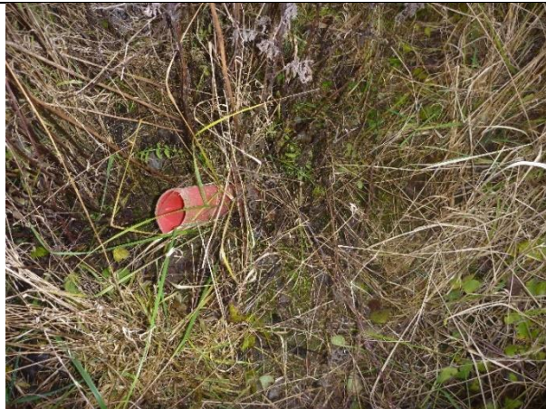
Fig. 9 Forerør fra en gammel boring?