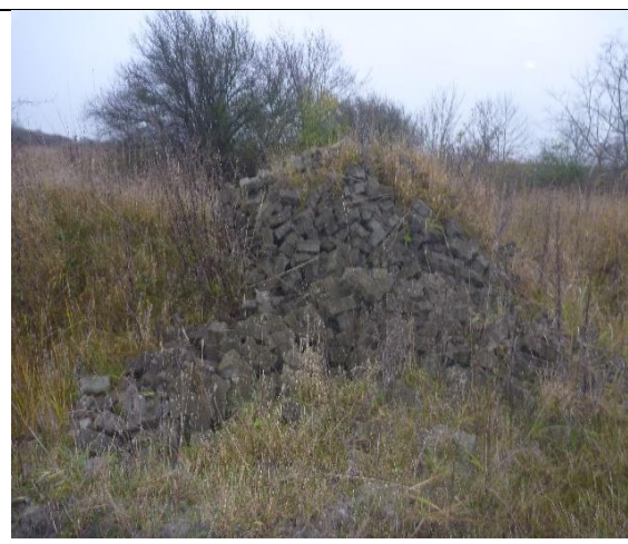
Fig. 4 Små oplag af brokker, jord, imprægneret træ m.m.