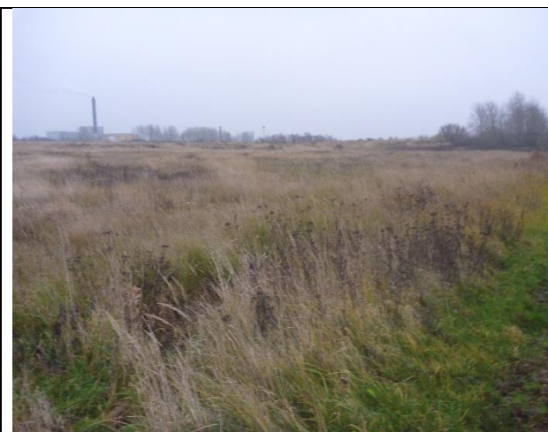
Fig. 3 Lossepladsen set fra syd. Næstved Affaldsenergi i baggrunden.

Der udføres ikke monitoring på Ydernæs Losseplads, men der er i 1994 udført en række borer, hvor kun to fremgår af Jupiter databasen. De gamle borer kan være relevante, hvis fornyet prøvetagning bliver nødvendig i forbindelse med vurdering om lossepladsens overgang til passiv tilstand. På tilsynet blev observeret et rør, som måske kan være et forerør fra en gammel boring, se fig. 8 og 9.