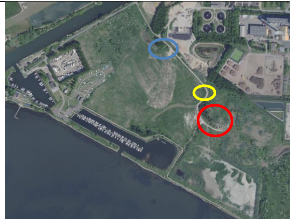
Fig. 8 Området med små oplag af brokker, jord m.m. er vist med rød ring. Blå ring er område med stor bjørneklo. Gul ring er området med evt. gammel boring.