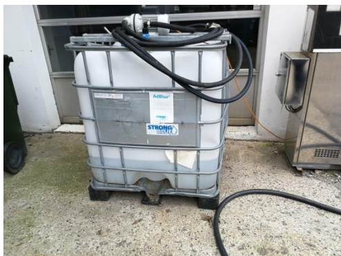
Billede 7. Oplag af AdBlue i pallettank.

Kommunen indskærper , at pallettanken opbevares med mulighed for at opsamle evt. spild. Indskærpelsen skal være efterkommet inden 3 måneder.