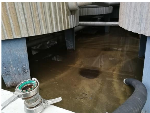
Billede 1: Regnvand i tankgård

I henhold til vilkår 11 i miljøgodkendelse af 27. oktober 2014, må der ikke stå vand i tankgårdene. På tilsynet den 19. november 2018 blev det konstateret, at der stod vand i en tankgård.