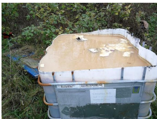
Billede 2: Overskåret palletank med ukendt indhold af affald.

På tilsynet den 19. november 2018 blev det konstateret, at en overskåret palletank med ukendt indhold af flydende affald, stod på ubefæstet areal. Tanken har overløb hver gang det regner.