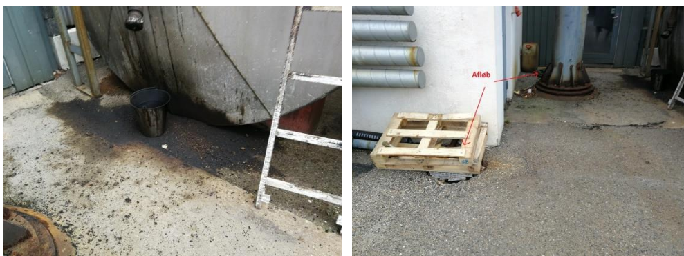
Billede 5 og 6. Spild af fuelolie og afstand til afløb.

Samtidigt indskræpes det, at spildbakken holdes tømt for regnvand. Hvis der er oliefilm på regnvandet i spildbakken, skal det indholdet bortskaffes som farligt affald.