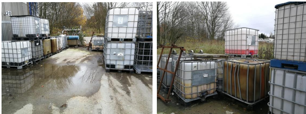
Billede 3 og 4: Oplag af palletanke med flydende indhold.

Kommunen indskærper , at virksomheden inden 3 måneder skal fremsende dokumentation for, at vilkår 30 kan overholdes.