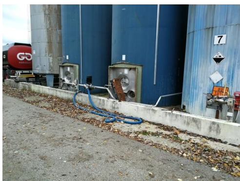
Billede 8. Tankgård

Kommunen indskærper , at vilkår 10 skal overholdes og at virksomheden inden 3 måneder skal indsende dokumentation for, at vilkåret er overholdt.