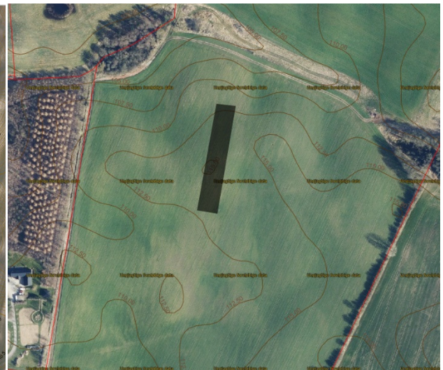
Figur 1-2 Alternativ 2