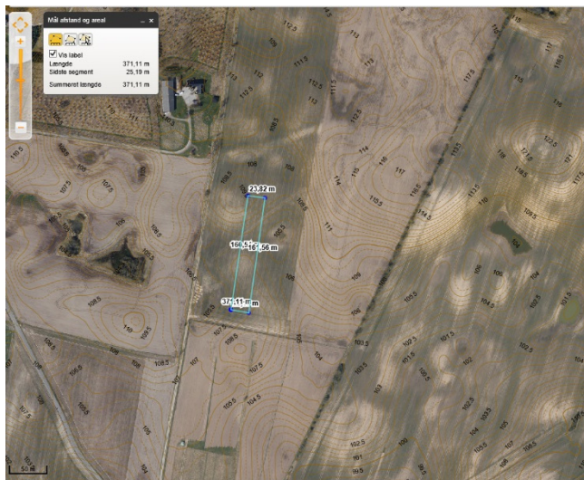
Figur 1-1 Alternativ 1