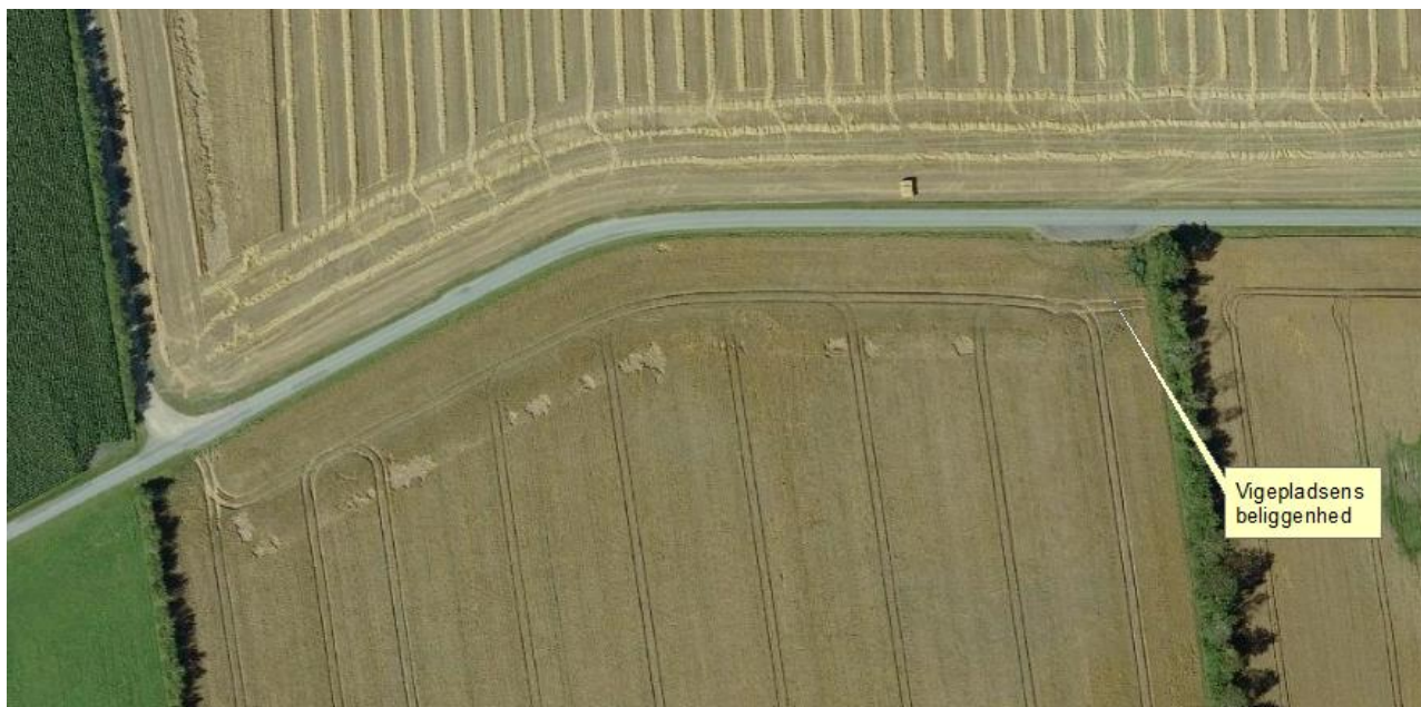
Figur 3. Vigepladsens beliggenhed.