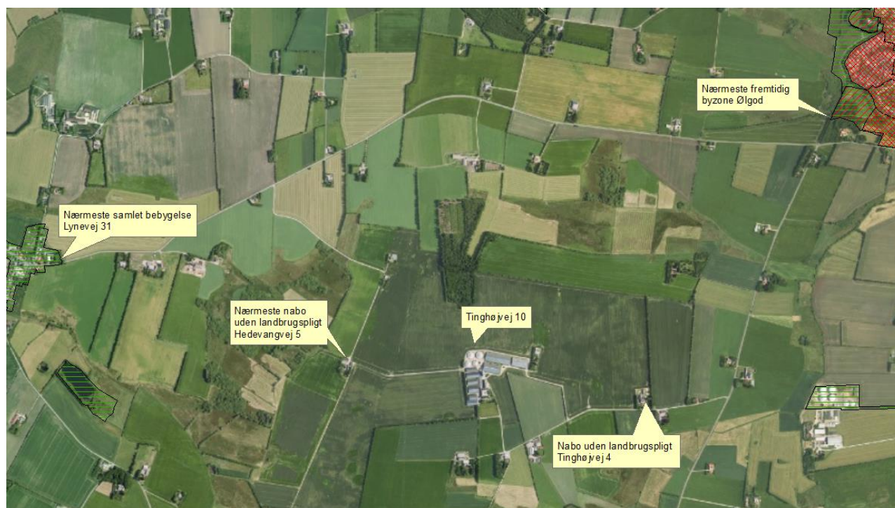
Figur 1. Husdyrbruget i forhold til byzone, samlet bebyggelse og nærmeste naboer uden landbrugspligt. Områderne, som er markeret med grønne vandrette striber, er udpeget som fremtidig landzone.

Beskrivet side 13-15 i miljøkonsekvensrapporten.