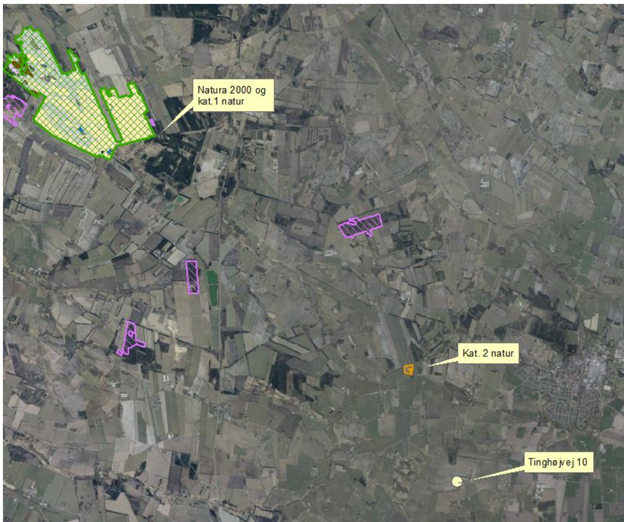
Figur 4. Nærmeste Internationale naturbeskyttelsesområde (Natura 2000), kategori 1 natur og kategori 2 natur.

Varde Kommune har i husdyrgodkendelse.dk foretaget beregninger, som viser, at ammoniakdepositionen i ansøgt drift til nærmeste Internationale naturbeskyttelsesområde bliver 0,0 kg NH 3 -N /ha/år.