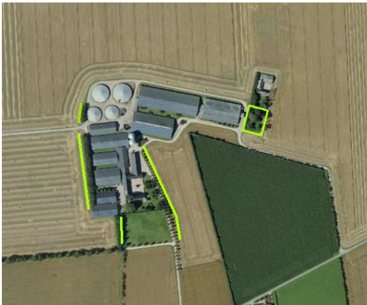
Figur 2. Der stilles vilkår om at eksisterende beplantning markeret med grønt skal bevares og vedligeholdes og om nødvendigt genplantes fremadrettet for at driftsbygninger og -anlæg er tilpasset landskabets karakter.

I overgangslandskaber skal nye bygninger og anlæg, der visuelt vil opleves fra dal- eller kystlandskaber tilpasses landskabets karakter, særligt med hensyn til beplantning, placering, udformning og materialevalg.