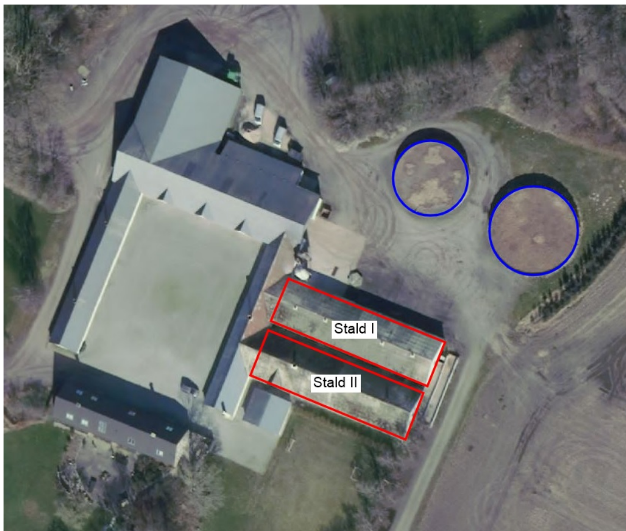
Indtegning af de stalde og gylletanke, som er aktive på husdyrbruget i dag.

Husdyrbruget drives i dag af dig i dit CVR nr 30370961. De to aktive stalde er senest renoveret i 1990-erne.