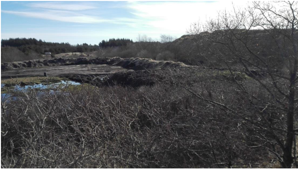
Kig mod øst over komposteringsplads med skrænt mod lukket deponi til højre