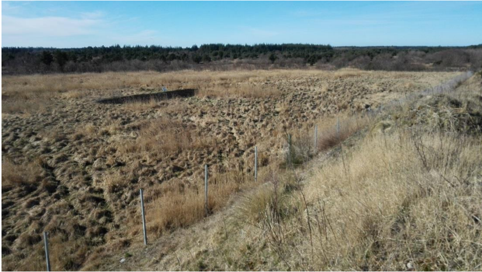
Fra oplagret opfyldningsjord over retableret deponi med kompostvindue