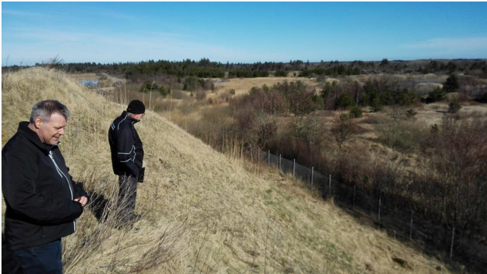
Mod nord fra østkant af deponi med oplagret opfyldningsjord