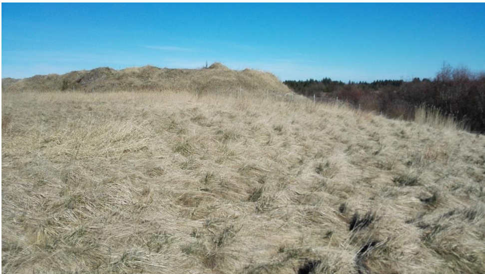
Mod nord på reableret deponi med oplagret opfyldningsjord