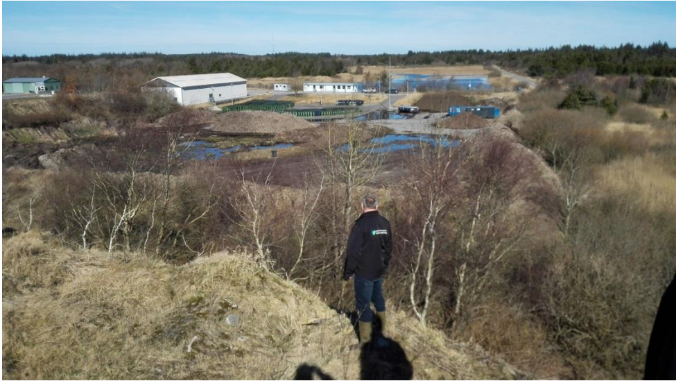
Kig mod nord fra oplagret opfyldningsjord ud over komposteringsplads og tidligere genbrugsplads