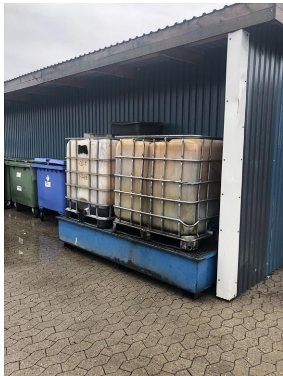
2. Opbevaring af affald under halvtag