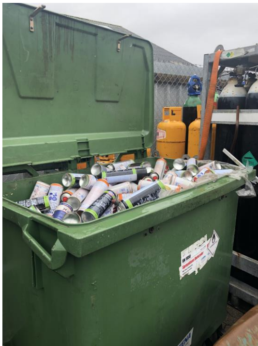
3. Sortering af spraydåser

AM handel & Service har desuden købt erhvervsadgang til genbrugspladsen for 3 køretøjer. Her afleveres de affald, som ikke indgår i de faste ordninger med Stena.