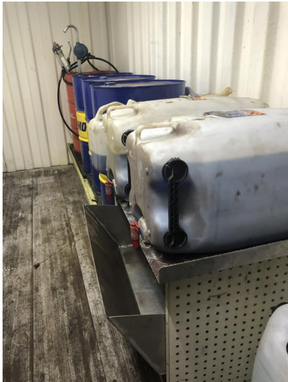
1. Opbevaring af råvarer og affald på spildebakker