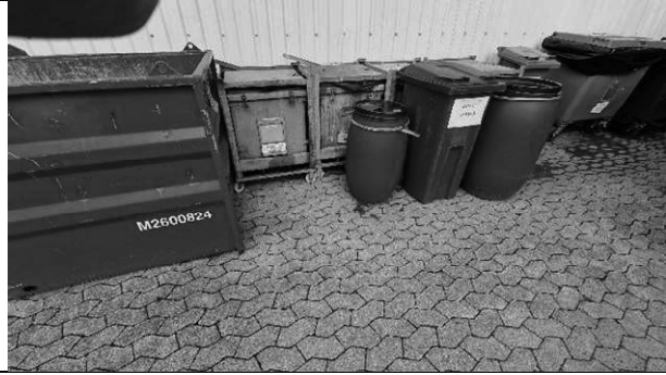
Foto 9 Opbevaring af affald. ABAS beholderne er med pose og indeholder ikke flydende affald.