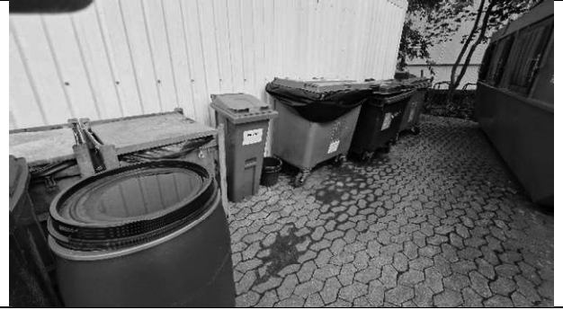
Foto 10 Opbevaring af affald. Epoxyaffald, oliefiltre med pose og elektronik affald.