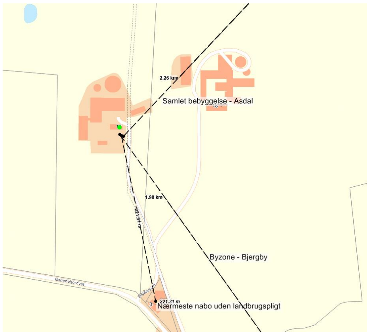
Figur 3: Nærmeste naboer uden landbrugspligt.

Kommunen vurderer kun at ejendommens gylletanke kan bidrage med lugtgener ved omrøring og udkørsel samt ved transport af gylle til opbevaring på anden ejendom, under forudsætning af at ejendommens gyllebeholdere drives efter reglerne herfor.