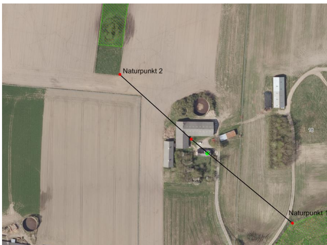
Figur 2: Husdyrbrugets beliggenhed i forhold til naturpunkt 1 og 2 (rød prik).