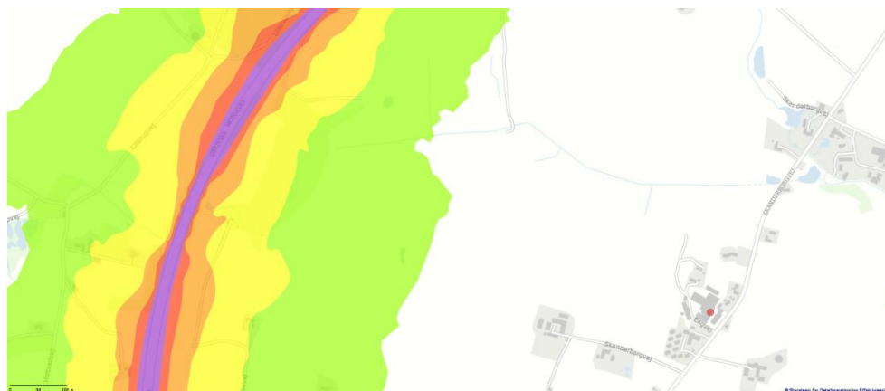
Kortbilag: Støjudbredelse fra motorvej. Kilde Miljøstyrelsens vejstøjkort.

Miljøstyrelsen vurderer, at mest betydende støjkilder ved Engvej 4 i natperioden op til 7, var støj fra henholdsvis motorvej 1,5 km mod vest samt Skanderborgvej 150 meter mod øst. Støjen fra begge veje var tydelig og stigende i løbet af perioden fra 6 til 7 pga. øget trafik på vejene. Øvrige kilder, der kunne registreres op til kl 7, var støj fra køletårn kilde nr. 15 og 20. Efter kl 7 kunne andre kilder fra virksomheden registreres. Kortmaterialet viser støjudbredelse fra motorvej overfor Engvej 4. Dertil kunne Miljøstyrelsen konstatere væsentlig støj fra Skanderborg. Støjdata herfra er ikke tilgængelig.