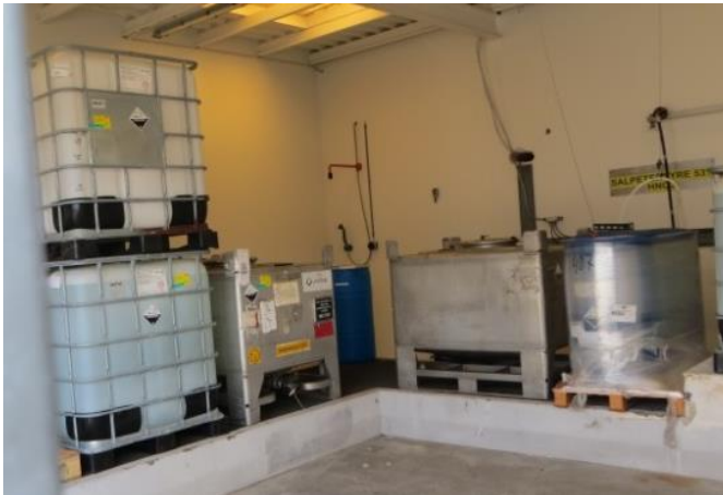
Beholdere med kemikalier og med affald står her, under tag, på tæt underlag, på et område, som kan rumme indholdet af den største beholder. (vilkår H2).