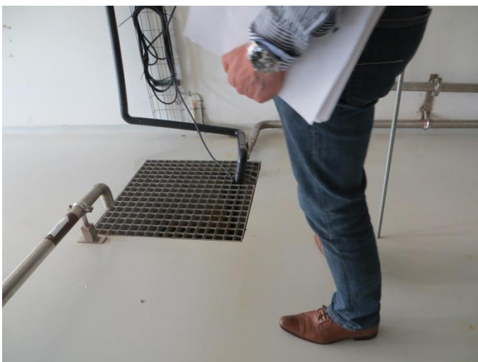
Spildevandssump. Virksomheden oplyste, at spildevand ledes til 2 buffertanke, hvor det neutraliseres, og herfra bortledes det efter aftaler med renseanlægget. Det betyder, at et eventuelt utilsigtet spild bliver opsamlet i tanke og først ledes i kloak, når det overholder kravene i forhold til renseanlægget (vilkår M1).

Spildevand ledes til Stevns Kommunes kloaksystem i henhold til en midlertidig tilslutningstilladelse, da der endnu ikke er meddelt endelig tilslutningstilladelse.