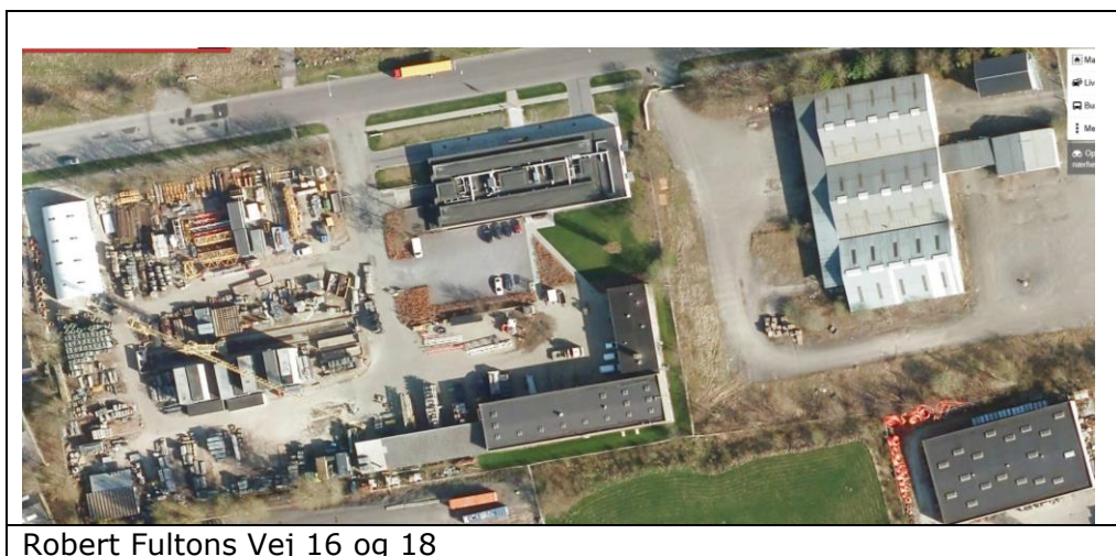
Robert Fultons Vej 16 og 18